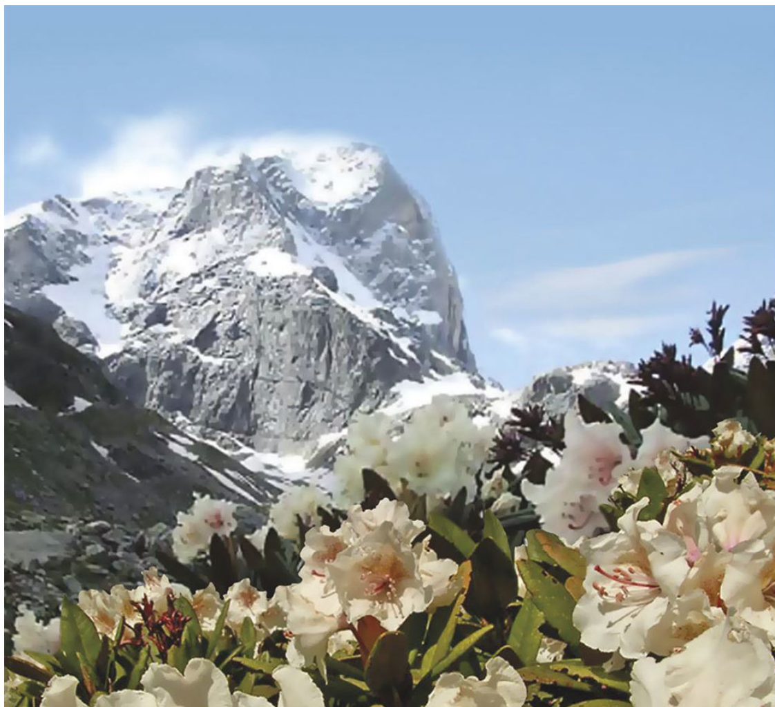
Аддала-Шухгельмеер, одна из вершин Дагестана

камни в оправе, вытянулись в цепочку залы и галереи. В пещере девять больших залов, самый крупный из них – зал «Грузинских спелеологов». Его длина 260 м, а высота доходит до 50 м.