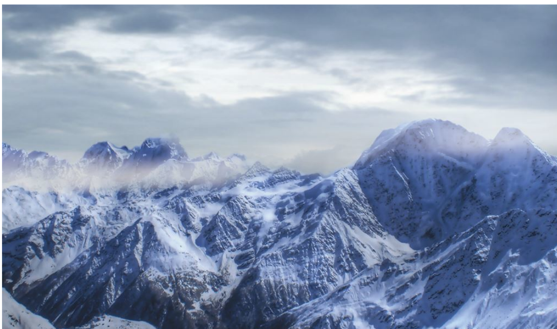
Большой Кавказский хребет

Вся территория Кавказа разделяется на три большие географические зоны, или региона: Предкавказье, Большой Кавказ и Закавказье. Каждый из этих регионов очень неоднороден и также подразделяется на несколько частей. К России относятся лишь Предкавказье и северные склоны Большого Кавказа. Часто выделяют Северный Кавказ – то, что находится к северу от Большого Кавказского хребта. Но эта зона довольно условна. Например, Азербайджан, традиционно относимый к Закавказью, на самом деле наполовину лежит к северу от Главного хребта. С другой стороны, Сочинский район, относимый к Северному Кавказу, расположен на юг от Главного хребта.