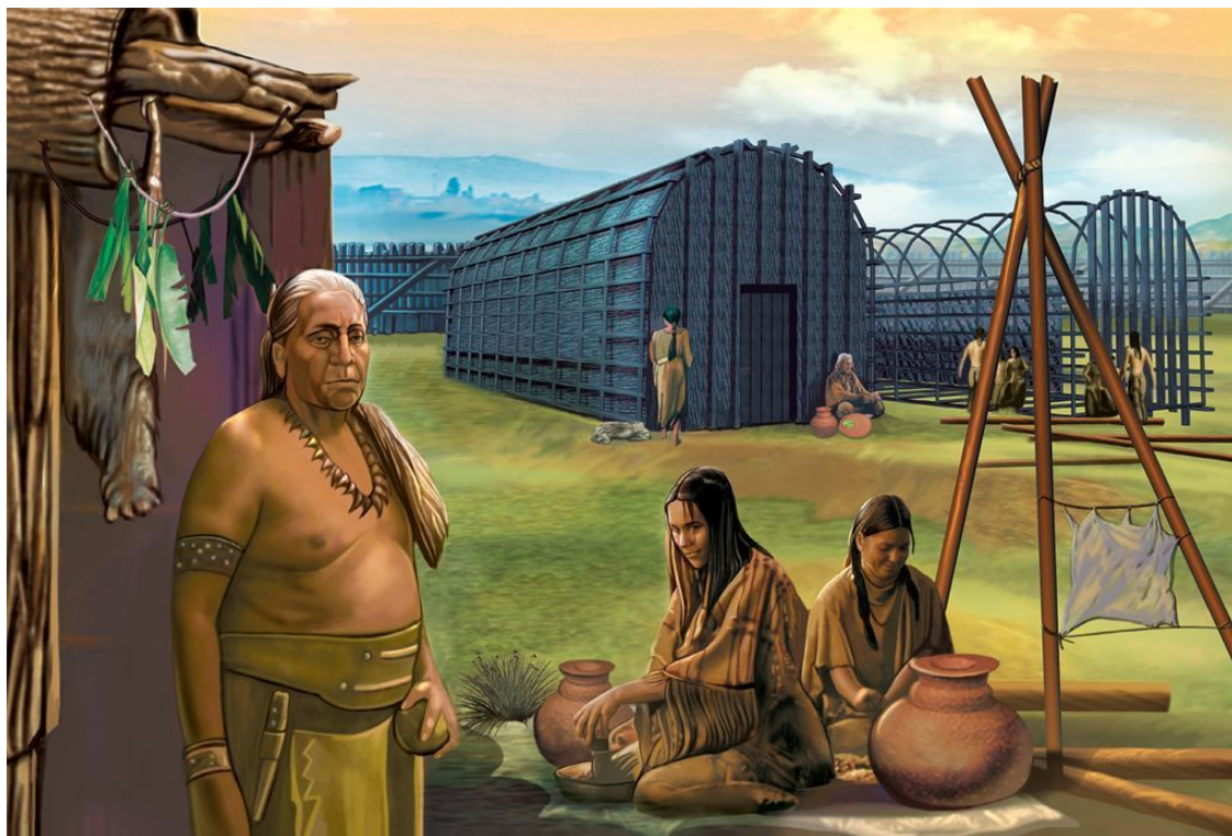
Деревня индейцев-ирокезов XVII в., состоящая из «больших домов», в каждом из которых обитало по несколько родственных семей