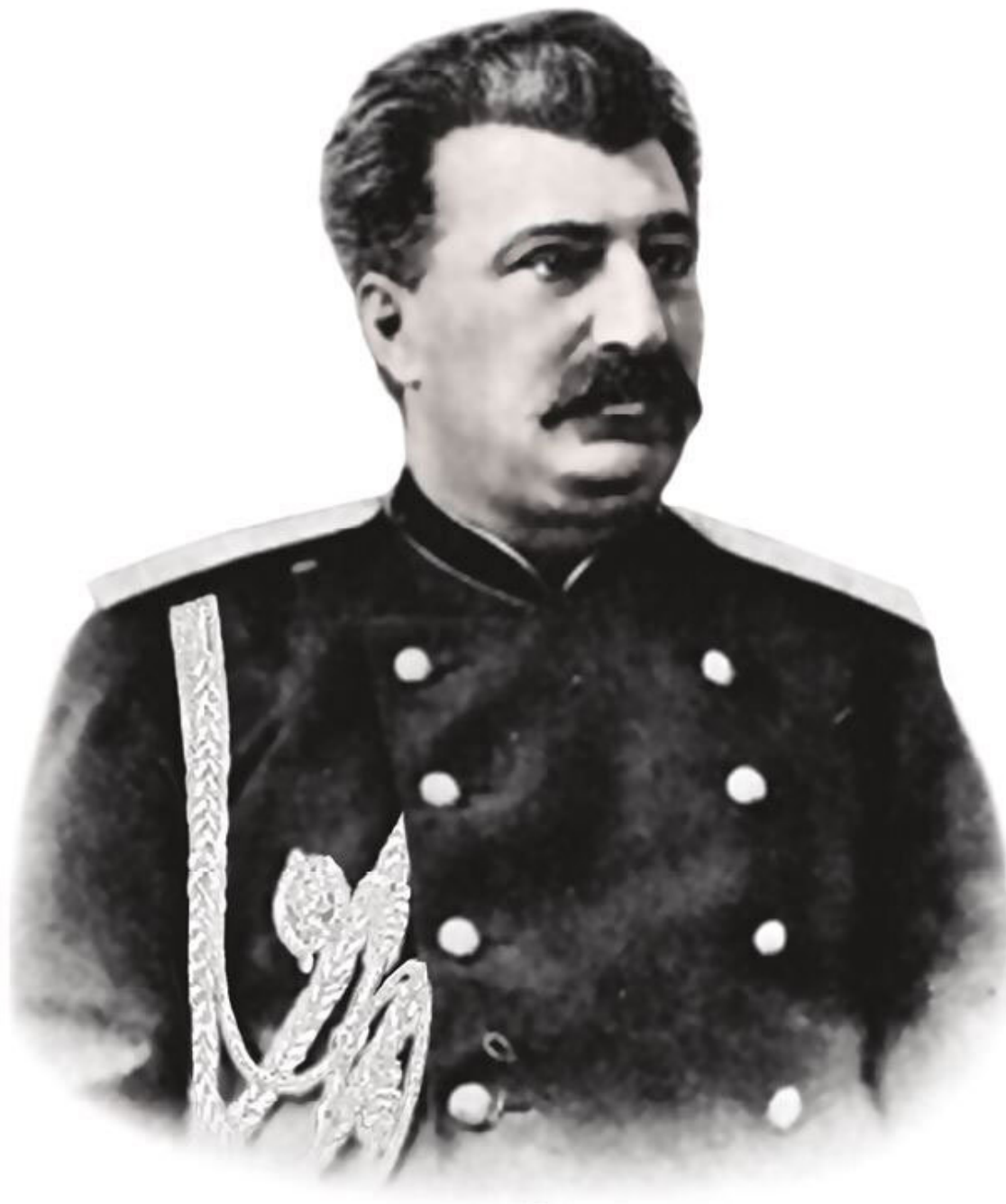
Н. М. Пржевальский

Кулана часто называют диким ослом, хотя это не совсем правильно. Это самостоятельный вид. Он состоит в родстве с ослом не в большей степени, чем с домашней лошадью. У кулана золотистая шерсть, темная короткая грива без челки и хвост с черной кисточкой. Его уши немного длиннее, чем у лошади, но не такие длинные, как у осла.