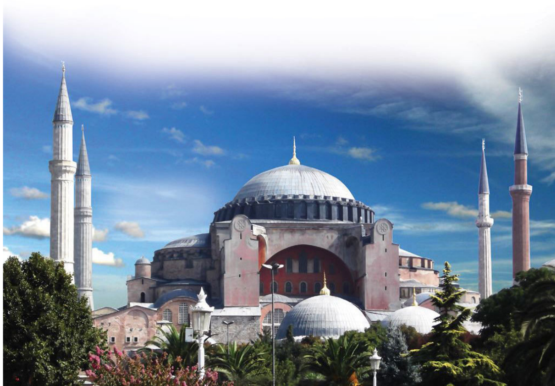
Софийский собор – выдающийся памятник византийской архитектуры