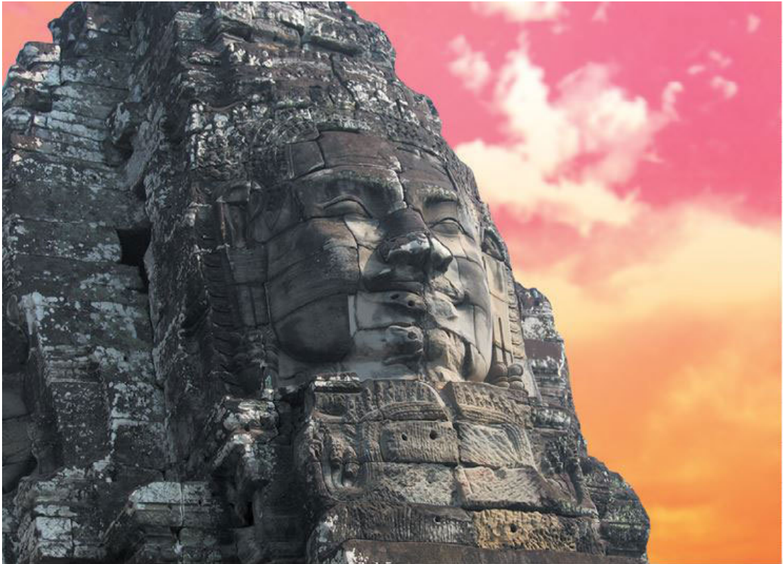
Изображение Будды из Байона