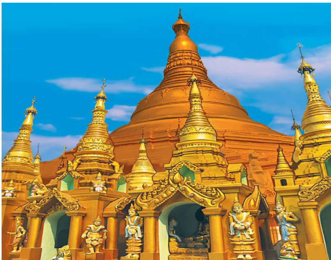
Шведагон – индуистская святыня Мьянмы