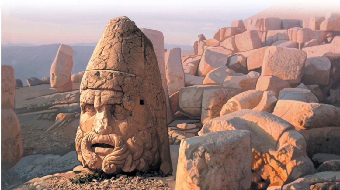
Гробницу на вершине Немрут-Дага охраняют статуи

На территории Турции, в юго-западной Анатолии находится странная гора. Она не слишком высока – всего 2200 метров над уровнем моря, однако давно привлекает к себе внимание. На вершине, среди каменных обломков находятся огромные скульптуры древних богов. В течение десятков веков огромные головы смотрят слепыми глазницами в голубое небо.