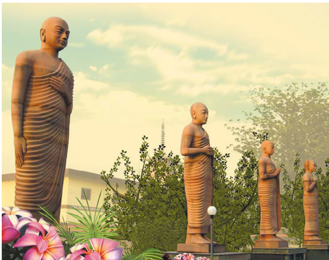
Индия. Статуи лам