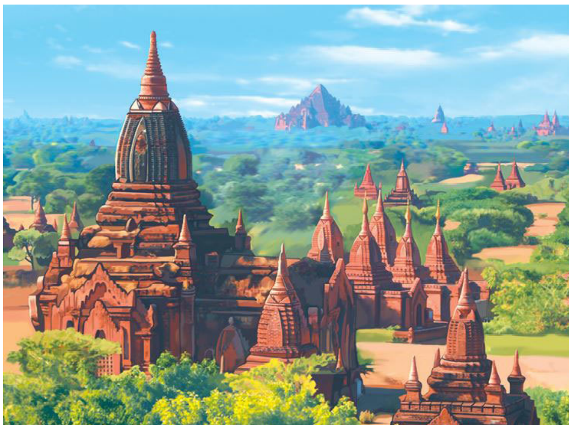
Храмовый комплекс Байон в Камбодже

Азия противоречива: с одной стороны, тонкая лирика, поэзия, каллиграфия, книжные миниатюры, духовная музыка, с другой – родина безжалостных орд степных кочевников, ритуальные самоубийства, летчики-камикадзе... Безбрежное синее небо над поднимающимися из моря скалами, теплое море с гротами и кораллами. А через час эта идиллия может обернуться жестоким тропическим штормом. Полгода солнце и полгода непрекращающиеся ливни. Азия непредсказуема. Там, где полтора века назад были нищие рыбацьи поселки, вырастают гигантские небоскребы. Азия работает как огромный муравейник и заваливает Европу товарами: дешевыми и дорогими, низкопробными и высококачественными. Азия многолюдна и плодотворна. Многие европейцы потянулись в Азию и стали здесь подолгу жить. Подальше от суеты и забот современной цивилизации, поближе к морю и джунглям. Какая она, Азия? Чем примечательна? Об этом наша книга.