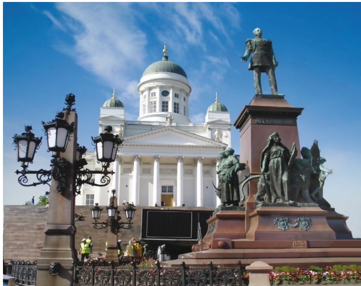
Памятник русскому царю Александру II в Хельсинки

Нахождение Финляндии в составе России немало дало финнам, хотя они всегда и стремились к независимости. В то время укрепилась и финская культура, и экономика. Финский язык был признан государственным. С подачи России у финнов появился главный закон страны – Конституция. В благодарность в столице страны был поставлен памятник русскому царю Александру II. Он стоит там до сих пор, несмотря на русско-финскую войну 1939 года. Кормить голубей и чаек на Сенатской площади, где стоит памятник, запрещается – соображения экологии.