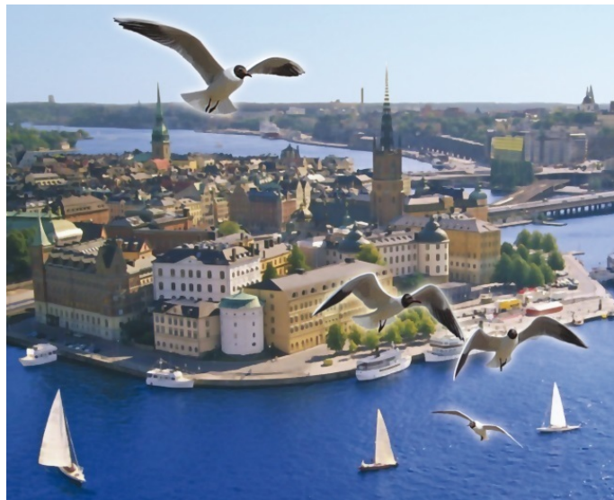
Стокгольм – город портовый

В конце XVII века Швеция была страной воинственной. С детства ее будущий предводитель – король Карл XII – был занят только военными играми. Повзрослев, он начал играть в войну по-настоящему. Карла не интересовали почести и награды. Кажется, даже результаты побед не очень волновали. Ему было важно находиться в самом состоянии войны, которая была его жизнью. Россия долго воевала со Швецией. Северная война длилась 21 год. Поражение под Нарвой в 1700 году заставило Петра I всерьез взяться за перевооружение своей армии. Позже, уже после знаменитой победы под Полтавой, он называл шведов своими учителями.