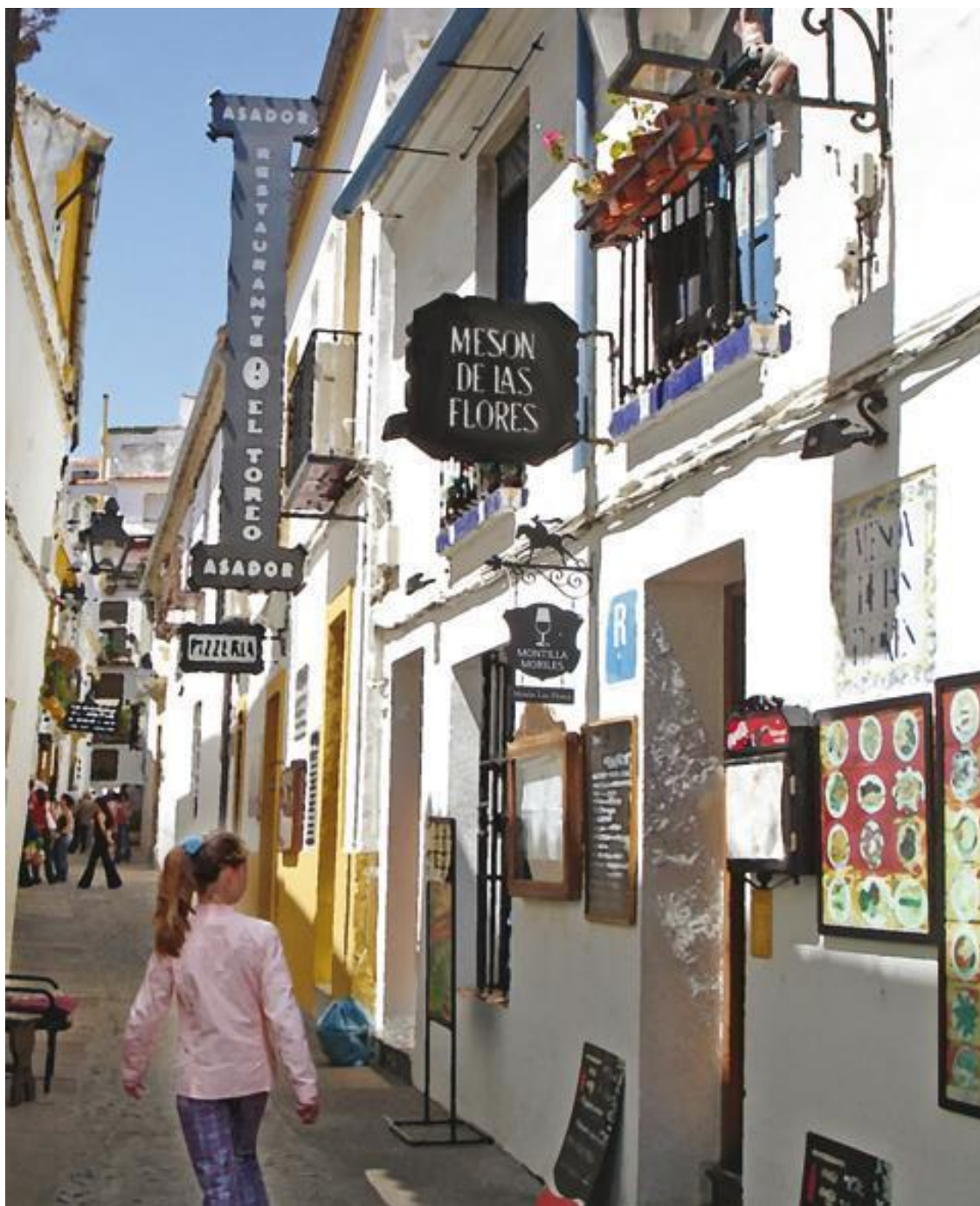
4 – Улочка в Кордове.