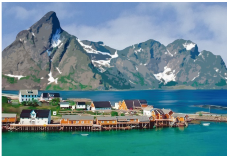
Суровая природа Скандинавии

На карте Европы Норвегия, Финляндия и Швеция образуют фигуру, немного напоминающую прыгающего льва. Швеция – передние лапы и брюхо, Финляндия – задние лапы, Норвегия – голова и хребет. Природа Скандинавии сурова. Около четверти ее территории лежит за Полярным кругом. Это означает, что зимой там солнце не поднимается над горизонтом, стоит длинная ночь.