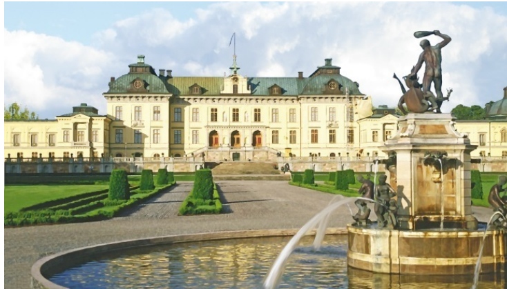
Дворцовые ансамбли Стокгольма

В наши дни Швеция – стабильная и процветающая страна. Ее образ связан со спокойной, мирной жизнью. С торжественными церемониями по вручению Нобелевских премий, которые ежегодно проходят в столице страны – Стокгольме. С музыкальным ансамблем 1970-х годов АББА, песни которого не забыты до сих пор. С веселым толстячком Карлсоном, которого придумала знаменитая шведская писательница Астрид Линдгрен.