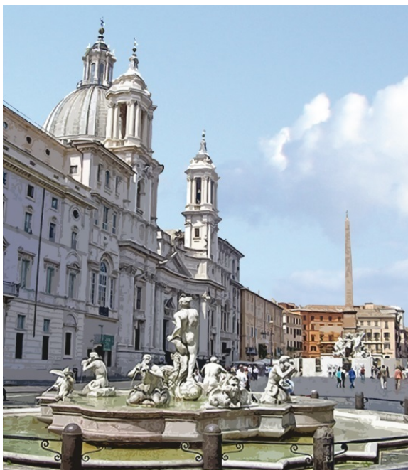
Площадь Навона в Риме

© В. А. Карачёв, текст, оформление обложки, иллюстрации, 2008–2015