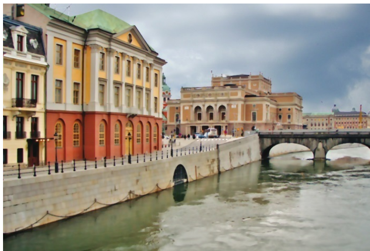
Некоторые уголки столицы кажутся петербургскими

В наши дни Швеция – стабильная и процветающая страна. Ее образ связан со спокойной, мирной жизнью. С торжественными церемониями по вручению Нобелевских премий, которые ежегодно проходят в столице страны – Стокгольме. С музыкальным ансамблем 1970-х годов АББА, песни которого не забыты до сих пор. С веселым толстячком Карлсоном, которого придумала знаменитая шведская писательница Астрид Линдгрен.