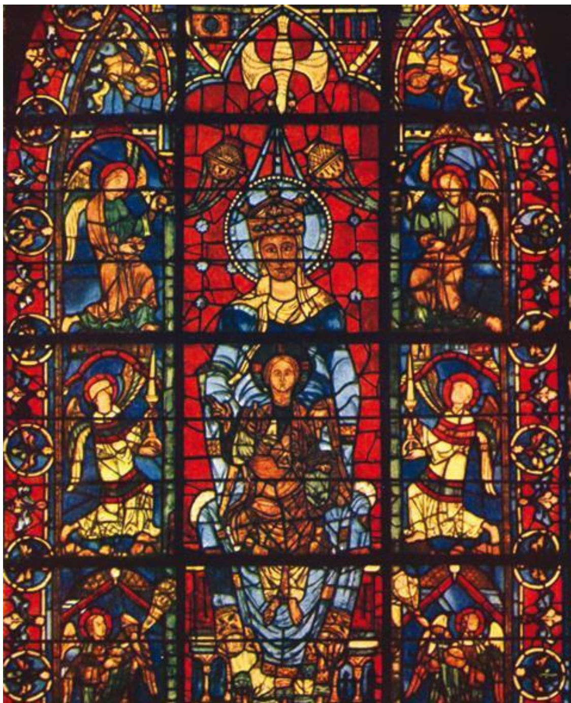
1 – Витраж Шартрского собора;