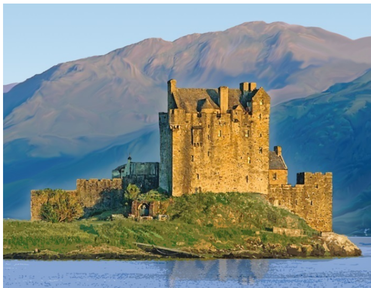
2 – Замок в Шотландии;