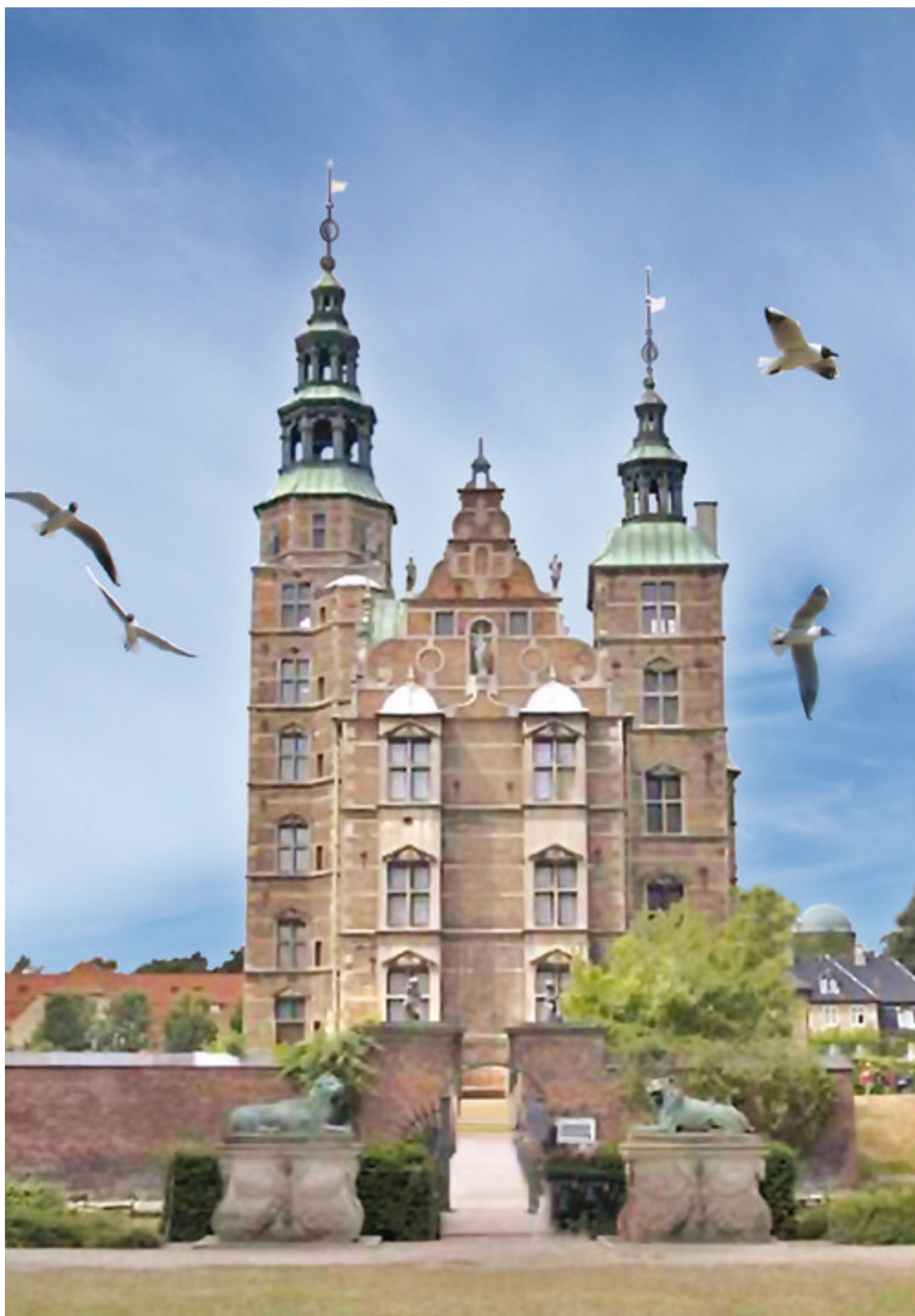
Дворец Росенборг в Копенгагене