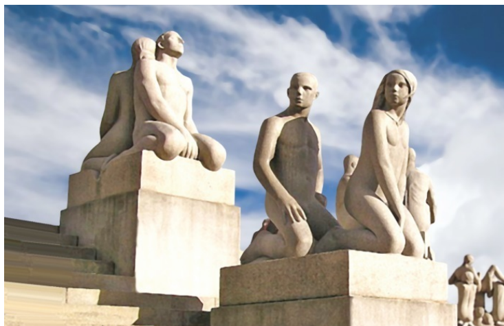
В парке скульптур Густава Вигеланда (Осло)

В Норвегии всего два крупных города: Берген – в XIII веке он был столицей Норвежского королевства – и Осло, современная столица. В этом городе обязательно надо посетить знаменитый Сад Людей. Так называют один из парков столицы, украшенный творениями норвежского скульптора Густава Вигеланда. Городские власти предоставили целый парк в полное распоряжение Вигеланду и согласились оплачивать достаточно скромные нужды художника. Условие было одно – все скульптуры после смерти Густава становятся собственностью Осло. Вигеланд успел создать в парке более 600 скульптур. Это были не короли и не выдающиеся личности. Просто люди. Однако в этих фигурах Вигеланд смог выразить самое важное в жизни каждого человека – рождение и смерть, любовь и ревность, любопытство и страх. Своим скульптурам он не давал названий, и у посетителей парка есть возможность самостоятельно поразмышлять над каждой.