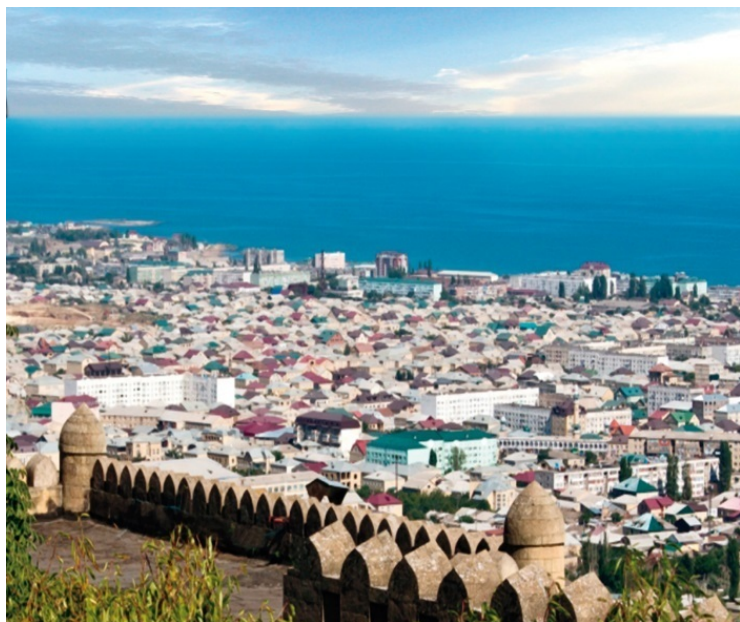
Дербент. Вид сверху

ли в качестве государственной религии иудаизм. В те времена проповедники еврейской религии активно действовали по всему Поволжью и Северному Кавказу. Даже в Киеве, «матери городов русских», в начале X века образовалась небольшая еврейская община. Часто бывали в Киеве и в других славянских городах арабские торговцы и мусульманские проповедники.