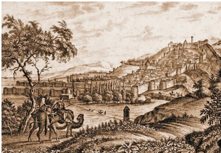
Дербент. Старинная гравюра

раннемусульманской эпохи. С нее и начинается история ислама на территории современной России.