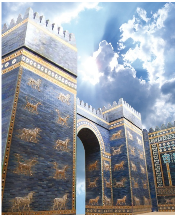
Ворота Иштар в Древнем Вавилоне

© В. А. Карачёв, составление серии, 2000–2019