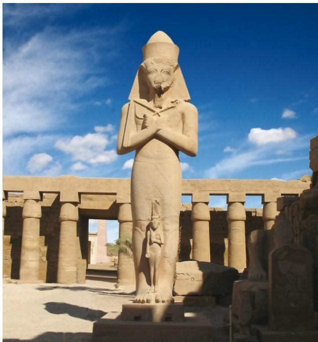
Храм с гипостильным залом в Карнаке