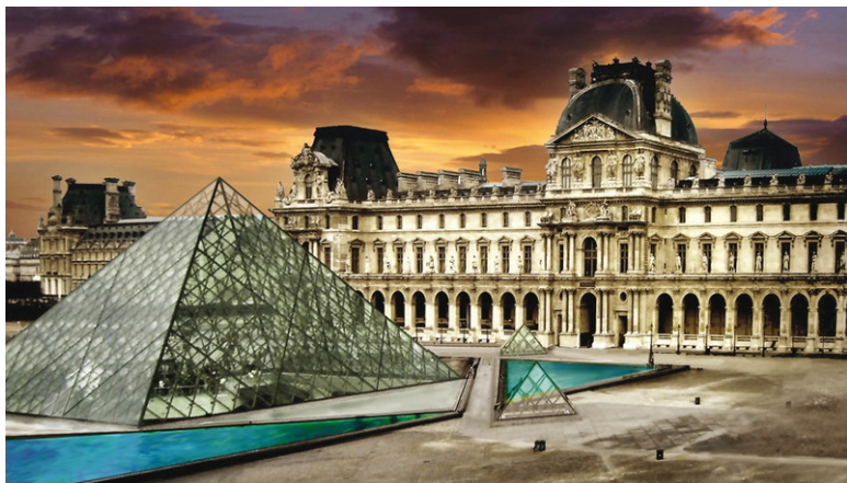
Во дворе Лувра

миды в Гизе, страна была на подъеме. Потом наступил упадок. Возведение гигантской пирамиды для каждого нового фараона стало стране просто не по силам. Историки давно подметили: как только дела у древних египтян шли в гору, они снова начинали строить пирамиды.