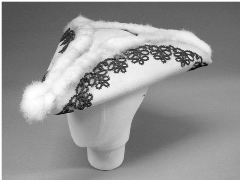
Ил. 1. Касторовая шляпа XVIII века

истории торговой Компании Гудзонова залива (Hudson's Bay Company) Эдвин Эрнст Рич, бобровая подпушь, предназначенная для изготовления шляп, оставалась наиболее ценным товаром из всех, что поставлялись в Европу, – со времени основания компании и до конца XVIII столетия. Ценой меха, впрочем, стали не только деньги.