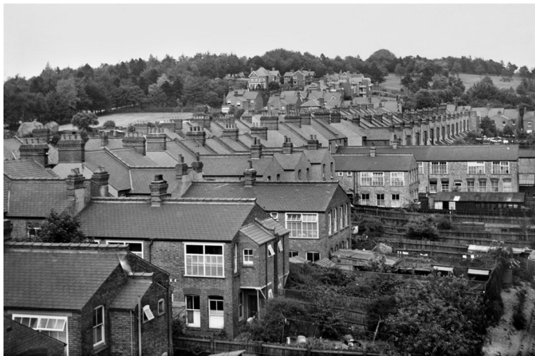
Ил. 5. Дома XIX века в Лутоне

внешнему вмешательству властей. Будучи нонконформистской как в культурном и политическом отношениях, так и по духу, лутонская шляпная отрасль не имела ни гильдий, ни союзов, ни официальных школ профессионального образования.