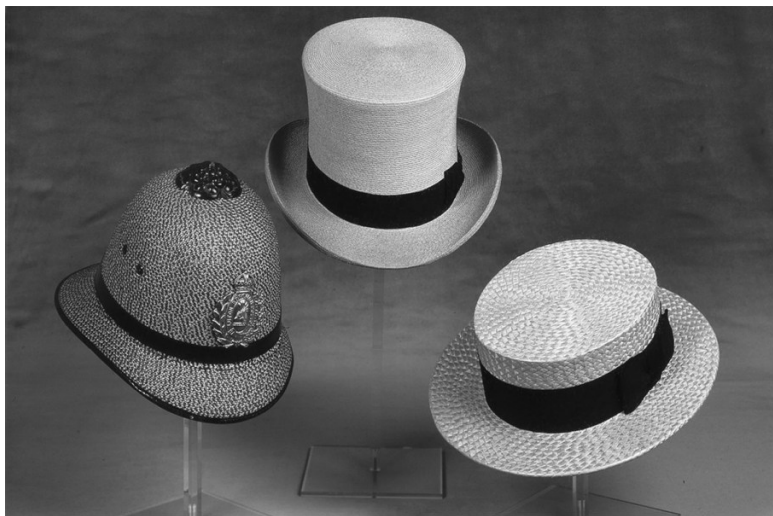
Ил. 6. Шляпы XIX века из лутонской соломки

коробок с надписью «Лутон» 30 . Мастерство дизайна вышло на первый план, но в Лутоне оно оставалось бессистемным. Были попытки открыть школы искусства и шляпного мастерства, но, поскольку это был Лутон, они так ни к чему и не привели.