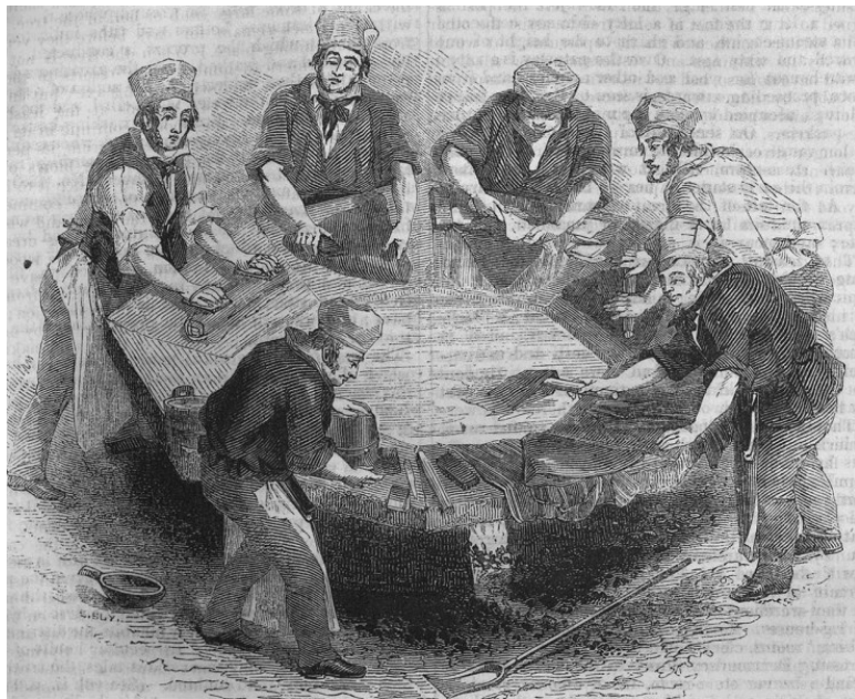
Ил. 4. Мастерская по изготовлению фетра, шляпники за работой. Penny Magazine. 1841

Все же шляпники более известны своим сумасшествием. Мы до сих пор используем выражение «безумен, как шляпник» – это явление увековечил Льюис Кэрролл в образе Безумного Шляпника. Бобровый мех, из которого изго-