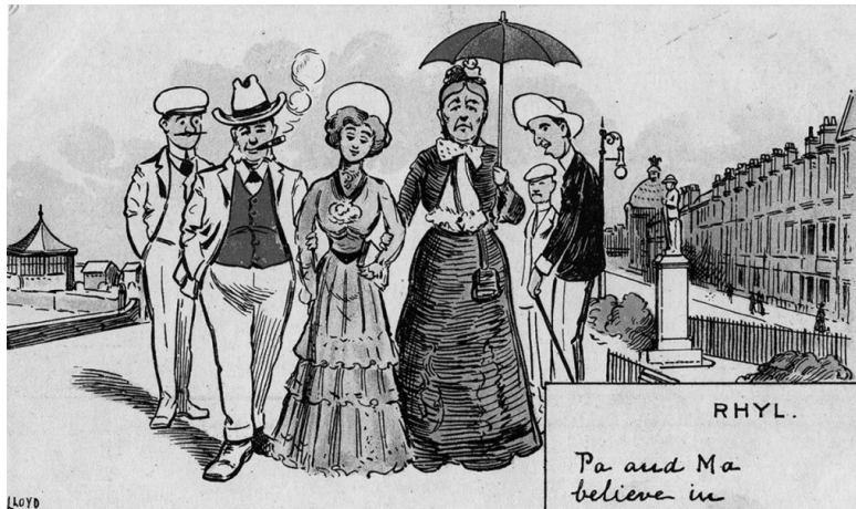
Ил. 1. Открытка с морского курорта. 1900

Шляпы попросту перестали быть повседневным аксессуаром каждого мужчины и каждой женщины. Тем не менее шляпы по-прежнему носят, и я постараюсь раскрыть мою тему, рассмотрев историческую роль шляп под разными углами зрения. Во второй главе говорится о шляпах и социальной власти, в третьей – о шляпах, маркирующих принадлежность к группе или профессии, в четвертой главе речь идет о связанных со шляпами правилах этикета, пятая глава посвящена двум культовым фасонам: котелку и шапо-бержер, шестая глава – о шляпах и мире развлечений, седьмая – о спортивных головных уборах, и, наконец, в восьмой главе я рассматриваю шляпы в контексте модной индустрии.