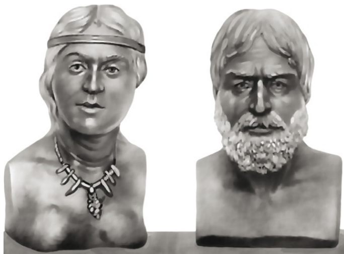
Люди эпохи мезолита из пещеры Мурзак-Коба (Горный Крым)

Вскоре греческие колонии настолько развились, что решили обособиться от своих метрополий и создать собственные государства. Херсонес стал столицей демократической республики, в состав которой вошли Керкинитида (современная Евпатория) и другие города-полисы западной части Тавриды. В восточной части сложилось Боспорское царство со столицей в Пантикапее.