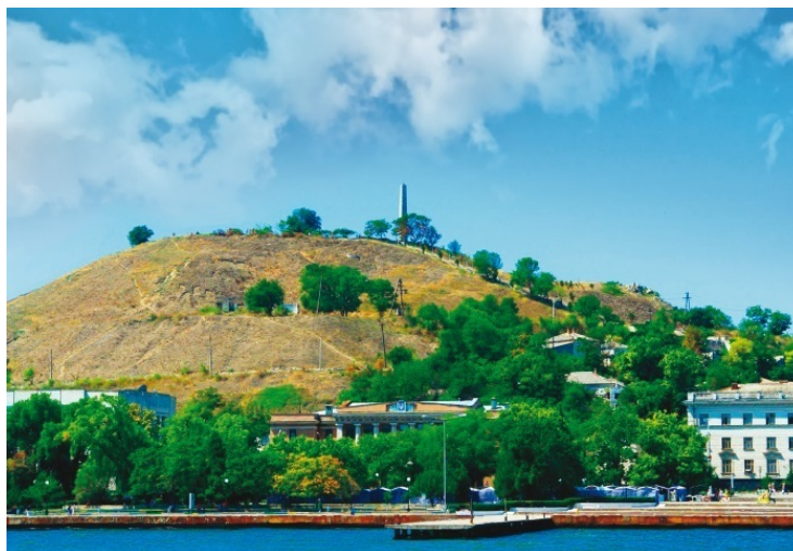
Гора Митридат в Керчи

Название горы Митридат связано с именем знаменитого понтийского царя Митридата Евпатора (132–63 до н. э.), которому удалось подчинить себе Боспорское царство. Затем он вступил в войну с Римом и, разбитый в сражении Помпеем, бежал, спасаясь от римлян, в Пантикапей. Здесь, запершись во дворце, беглец стал строить грандиозные планы, как отомстить Риму. Подобно Ганнибалу, он рассчитывал вторгнуться в Италию с севера, через Альпийские горы. Однако те воины, которые остались у Митридата, не горели желанием продолжать кровопролитную войну. Тогда царь решил призвать в поход кочевников-скифов. Их появление в боспорских городах вызвало возмущение жителей. Против Митридата вспыхнуло восстание не только народа, но и войска, и даже его сыновей.