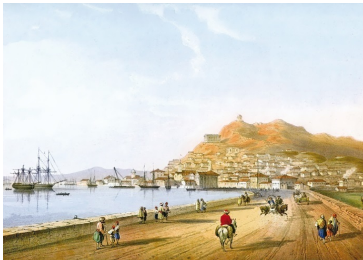
Керчь. Литография К. Боссоли, 1856 г.

Название горы Митридат связано с именем знаменитого понтийского царя Митридата Евпатора (132–63 до н. э.), которому удалось подчинить себе Боспорское царство. Затем он вступил в войну с Римом и, разбитый в сражении Помпеем, бежал, спасаясь от римлян, в Пантикапей. Здесь, запершись во дворце, беглец стал строить грандиозные планы, как отомстить Риму. Подобно Ганнибалу, он рассчитывал вторгнуться в Италию с севера, через Альпийские горы. Однако те воины, которые остались у Митридата, не горели желанием продолжать кровопролитную войну. Тогда царь решил призвать в поход кочевников-скифов. Их появление в боспорских городах вызвало возмущение жителей. Против Митридата вспыхнуло восстание не только народа, но и войска, и даже его сыновей.