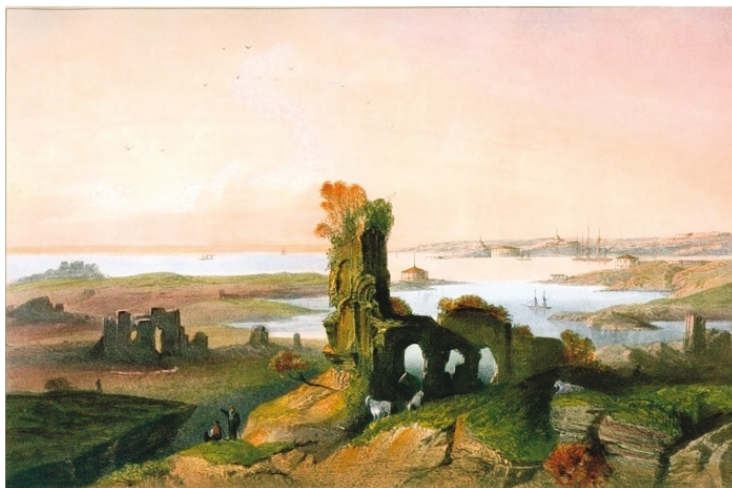
Развалины древнего Херсонеса. Литография К. Боссоли, 1856 г.

Когда недавно Крым возвращался в состав России, некоторые политики предлагали вернуть ему первоначальное название: Таврида. Дескать, Тавридой полуостров вошел в Россию при Екатерине II, Тавридой должен и вернуться. И вообще, название «Крым» появляется на российских и европейских картах только в XVII веке, а до того в течение двух тысячелетий полуостров был Тавридой и в Российской империи входил в состав Таврической губернии.