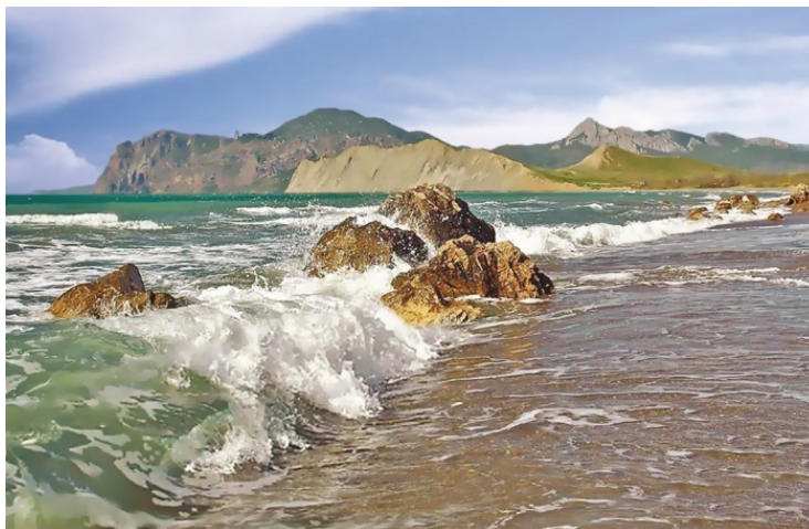
Крым омывают Черное и Азовское моря

Степная зона – плоская равнина со скудной растительностью. Продолжительное жаркое лето иссушает ее. Знойные суховеи проносятся по ковылю и полыни. Дожди бывают редко. Только весной степь немного оживает, покрываясь маками. Обычные обитатели – зайцы, суслики, тушканчики, на побережье встречаются дрофы, журавли, куропатки, в небе парят степные орлы и луни. Степной Крым всегда страдал от недостатка поливной воды. Вести здесь сельское хозяйство стало возможным после строительства в 1961–1971 годах Северо-Крымского канала, подающего на полуостров воду из Днепра.