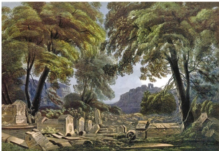
Караимское кладбище. Литография К. Боссоли

Пантикапей не уступал Херсонесу в размерах. На горе Митридат стоял акрополь с храмом Аполлона. Вокруг столицы Боспорского царства располагались другие греческие поселения. Основу процветания их составляла торговля зерном. Боспор считался житницей Греции. Пшеницу выращивали на плодородных полях Керченского полуострова. Примечательно, что на границе царства был сооружен высокий вал, а перед ним – глубокий ров, наполненный водой.