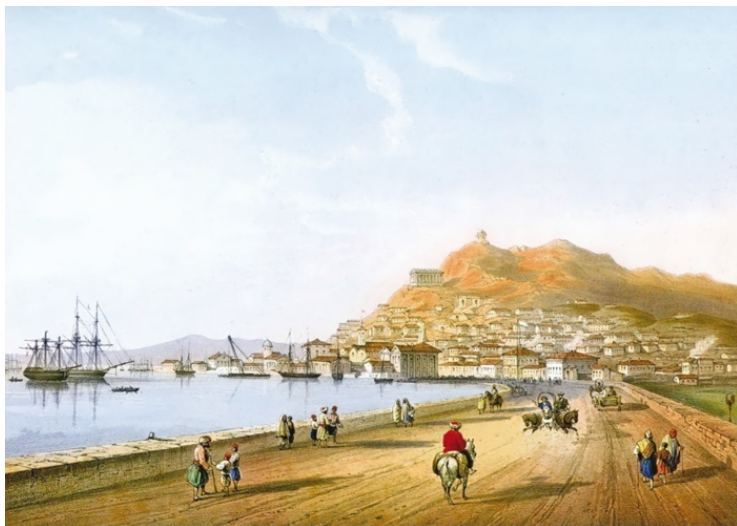
Керчь. Литография К. Боссоли, 1856 г.

Греки присвоили двум узким проливам, расположенным на двух концах нынешнего Черного моря, одинаковое название: «Босфор» то есть «бычий брод». Первый пролив в Стамбуле сохраняет на европейских языках греческое название, а второй Босфор называется ныне Керченским проливом. Отсюда и происходит название царства: Босфор или Боспор.