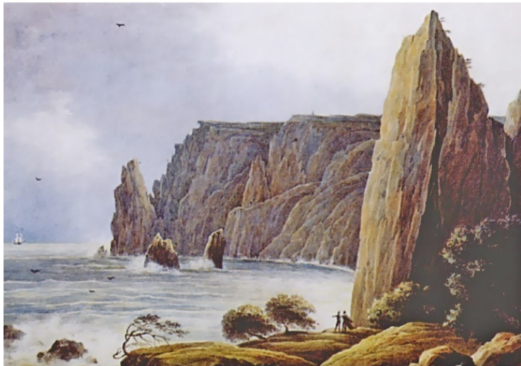
Н. Г. Чернецов. Крымский пейзаж, 1839 г.

По своим размерам Крым не уступает иному европейскому государству. Большая его часть представляет собой степь, охватывающую север, запад и восток полуострова. Среднюю часть занимают Крымские горы, и маленькую полоску – Южный берег. Каждая из этих трех природных зон совершенно не похожа на другую, обладает своим климатом и другими особенностями.