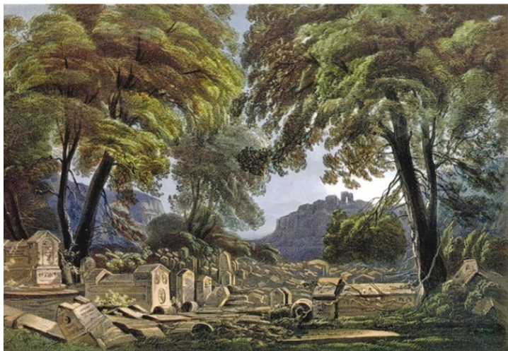
Караимское кладбище. Литография К. Боссоли

Херсонес славился своим вином, которое поставлялось в Грецию и высоко ценилось у скифов. В центре города стоял храм с огромной статуей богини Афины. Рядом располагалась агора – площадь, где шла торговля, а также происходили народные собрания. В городе жил собственный историк – Сириск; народное собрание постановило увенчать его золотым венком, за то, что он написал историю Херсонеса. К сожалению, этот труд не сохранился и до нас не дошел.