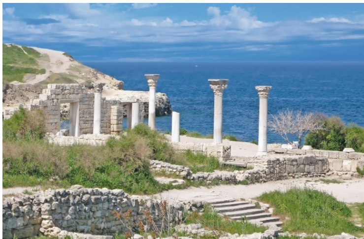
Херсонес. Современный вид

Первыми обитателями Крыма, о которых мы можем узнать из трудов античных историков, были кочевники-киммерийцы. В VII веке до н. э. их сменили скифские племена, которые построили несколько крепостей, в том числе свою столицу в Крыму – Неаполь Скифский. Ныне это городище находится в черте современного Симферополя на реке Салгир.