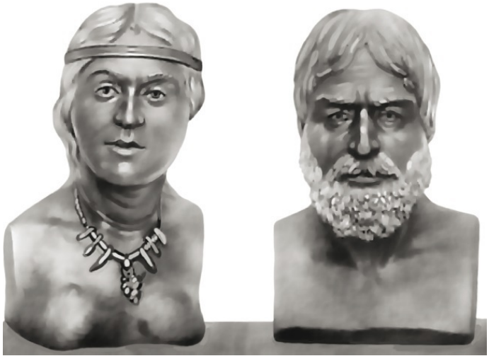
Люди эпохи мезолита из пещеры Мурзак-Коба (Горный Крым)

Вскоре греческие колонии настолько развились, что решили обособиться от своих метрополий и создать собственные государства. Херсонес стал столицей демократической республики, в состав которой вошли Керкинитида (современная Евпатория) и другие города-полисы западной части Тавриды. В восточной части сложилось Боспорское царство со столицей в Пантикапее.