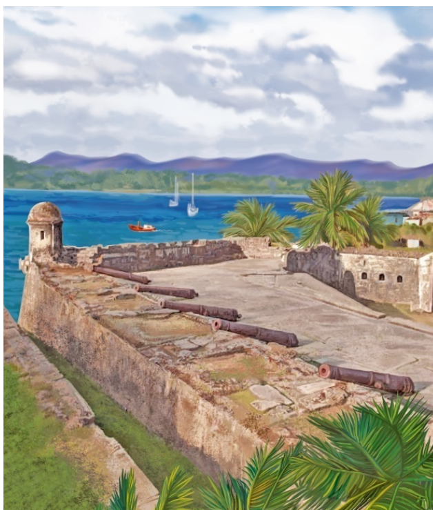
В Панаме много исторических памятников

Объем товаров, которые надо было перевозить от восточного побережья страны на западное, резко возрос. И американцы всерьез призадумались, не сократить ли им путь. Экономия получилась огромная – в 13 тысяч километров морского пути.