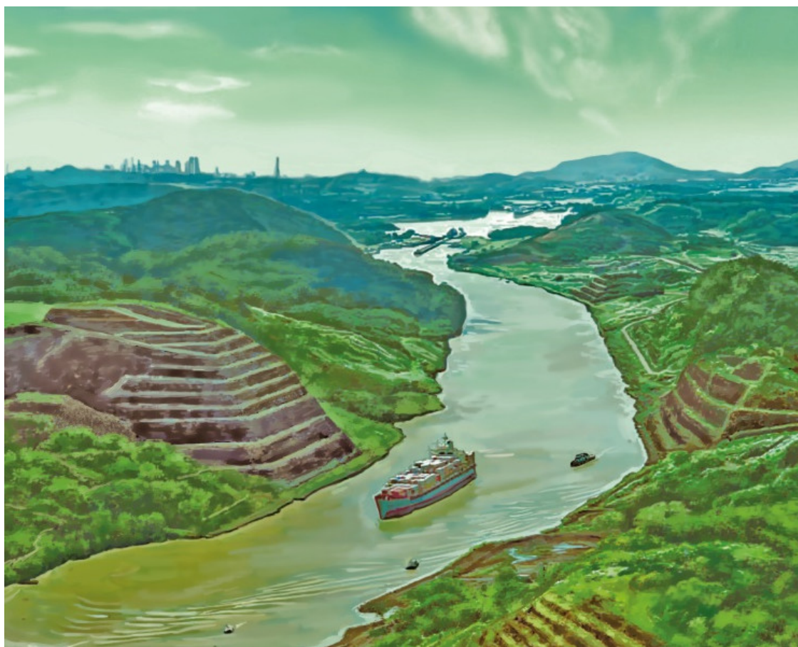
Панамский канал – одно из величайших гидротехнических сооружений

История Панамского канала в чем-то напоминает историю канала Суэцкого, который соединяет Средиземное и Красное моря. Задолго до начала строительства было очевидно, что канал прокладывать надо. Ведь для того чтобы попасть из Атлантического океана в Тихий, судам приходилось огибать Южную Америку, так сказать, снизу. Путь этот ой какой неблизкий. А тут пожалуйста – совсем небольшой отрезок суши шириной всего каких-то 80 километров, и товары переправлены из одного океана в другой.