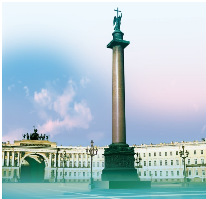
Александровская колонна в Петербурге

Давайте совершим воображаемое путешествие по России. Начнем, конечно, со столицы страны – Москвы. Потом посетим Северную столицу – Петербург. Затем побываем в старинном русском городе Пскове. Оттуда недалеко до Новгорода. Далее поедem на север, полюбуемся деревянными церквями Кижей и каменными башнями Соловков. С берегов Белого моря через Ярославль и Сергиев Посад доберемcя до Владимира и Суздаля и далее, вниз по Волге, поплывем к стенам древнего Казанского кремля.