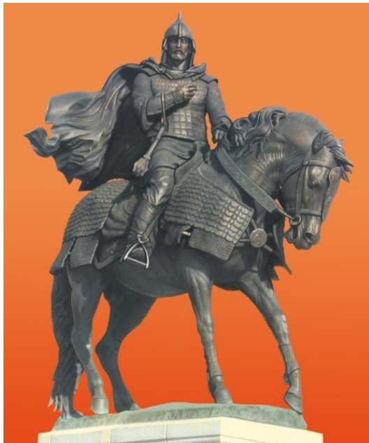
Памятник Дмитрию Донскому в Коломне

Построенный им мощный шестистолпный пятиглавый Архангельский собор был возведен по всем правилам традиционного русского каменного зодчества. Однако если приглядеться, в нем видны и итальянские черты. Фасады храма разделены карнизом на две горизонтальные части, заметны плоские колонны – пилястры, на Руси таких раньше не делали.