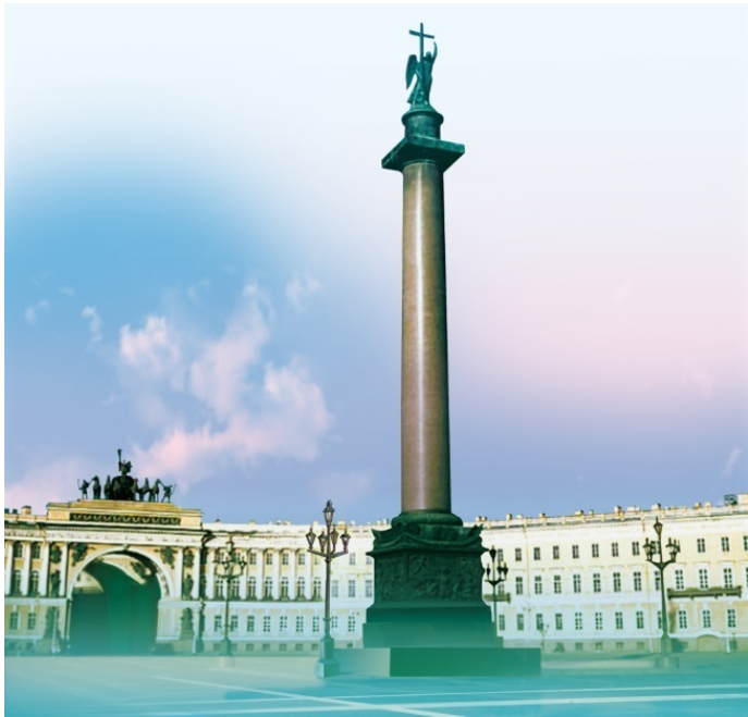
Александровская колонна в Петербурге

Давайте совершим воображаемое путешествие по России. Начнем, конечно, со столицы страны – Москвы. Потом посетим Северную столицу – Петербург. Затем побываем в старинном русском городе Пскове. Оттуда недалеко до Новгорода. Далее поедem на север, полюбуемcя деревянными церквaми Кижей и каменными башнями Соловков. С берегов Белого моря через Ярославль и Сергиев Посад доберем-