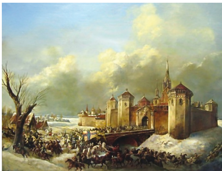
Взятие крепости Ниеншанц

В начале мая Петр со своими помощниками обследовал устье Невы и нашел подходящее, на его взгляд, место для крепости: пустынный островок, который финны называли Заячьим, а шведы – Веселым. Если вам доведется быть в Петропавловской крепости, вы услышите легенду о том, как Петр I в присутствии духовенства, генералов и высших чинов государства собственноручно закопал в землю острова золотой ковчег. В нем были мощи Андрея Первозванного, а на крышке было написано: «1703 мая 16-го основан царствующий град Санкт-Петербург».