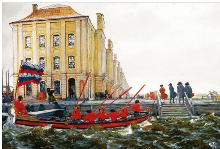
Петербург начала XVIII в.

Строители Петербурга сразу же столкнулись с небывалыми трудностями. Почва почти везде была болотистая, зыбкая. Прежде чем что-либо строить, нужно было осушить участок. Для этого копали каналы и пруды, а вынутую землю использовали на подсыпку низких мест. Но это еще далеко не все. Чтобы укрепить почву под будущим строением, нужно было забить в нее сваи – толстые обтесанные бревна. Сотни тысяч свай были забиты в землю при строительстве Петербурга! Это была адски тяжелая работа – ведь все делалось вручную. Но и на этом «нулевой цикл» не заканчивался. Между торчавшими из земли концами свай закладывали фашины – толстые и длинные пучки березовых или липовых прутьев, сверху насыпали гравий, щебень, песок и только после этого сооружали фундамент. Столько же усилий уходило на то, чтобы проложить улицу или дорогу.