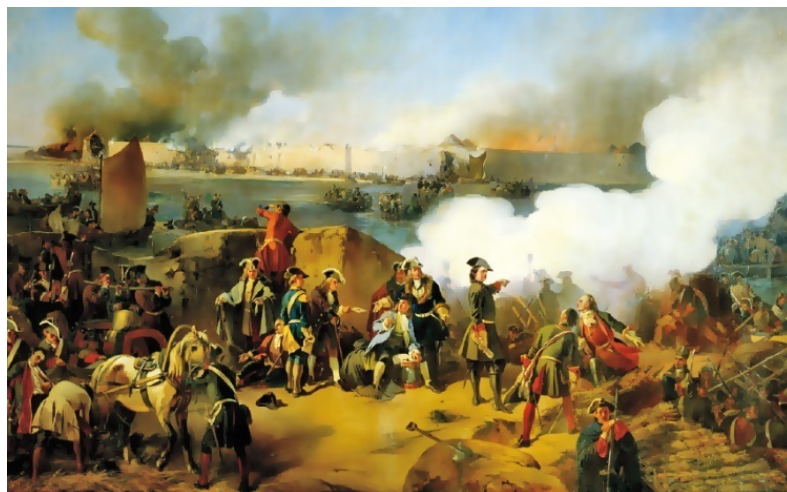
Штурм крепости Нотебург

Санкт-Петербург красив в разные времена года, но весна ему особенно к лицу. Все прозрачнее ночи, все длиннее закаты. Вот уже куранты Петропавловского собора пробили 11 раз, но все еще светла Адмиралтейская игла... В самом начале этой волшебной поры – 27 мая – Санкт-Петербург празднует свой день рождения. И невольно думаешь: может быть, этот дивный город и родился здесь потому, что его основателя заворожил когда-то майская белая ночь?