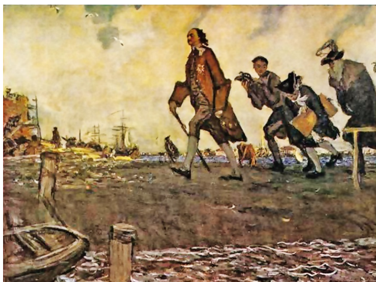
Петр I на Заячьем острове

Остров был слишком узок для мощной бастионной крепости, поэтому Петр приказал расширить его в сторону Невы. Солдаты делали из сосновых бревен ящики (ряжи), перетаскивали их на мелководье и заполняли камнями, а сверху засыпали землей. Поэтому нынешний Заячий остров гораздо шире и на несколько метров выше того, что был в начале XVIII века. Стены и бастионы сначала были земляными (кирпичными их стали заменять через три года). Осенью 1703 года крепость уже была готова встретить шведов огнем трехсот пушек. Но стрелять по врагу им не пришлось – вход в устье Невы надежно закрыл Кронштадт.