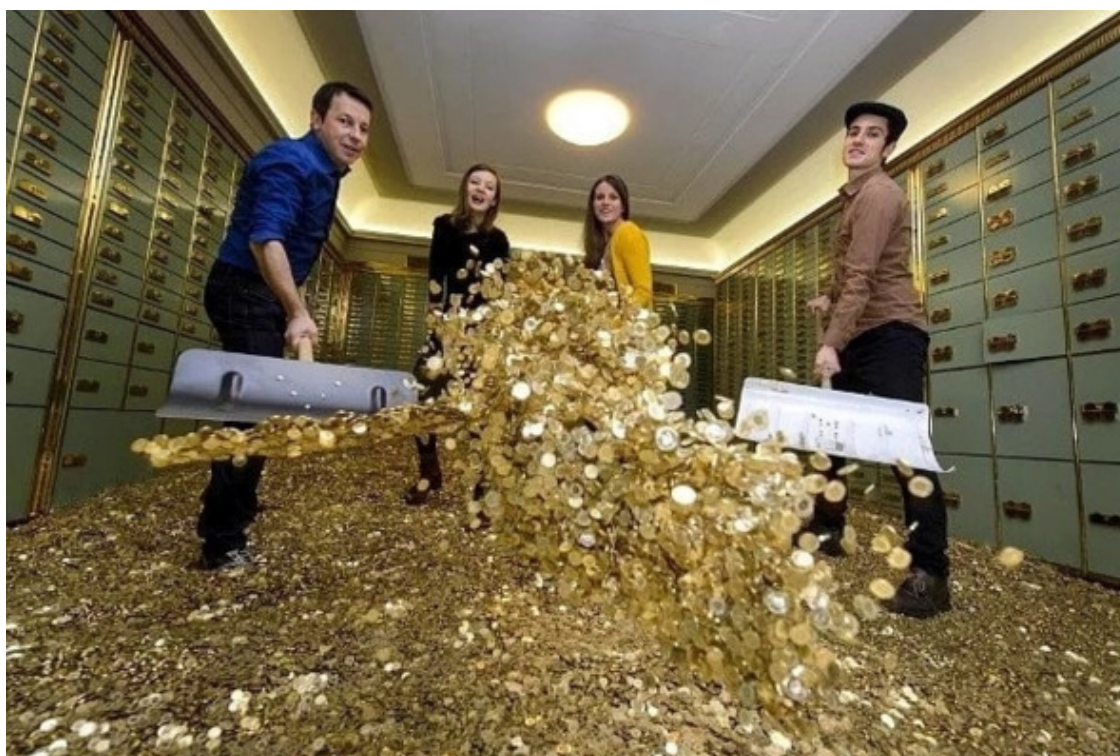
Золото гребут лопатами

А, русские, точно, не отказались бы от 1 000 франков. Наверное поэтому и референдумы в России не проводятся (хотя, согласно Конституции, проводить референдумы положено): вдруг глупый народ проголосует не за то, что нужно.