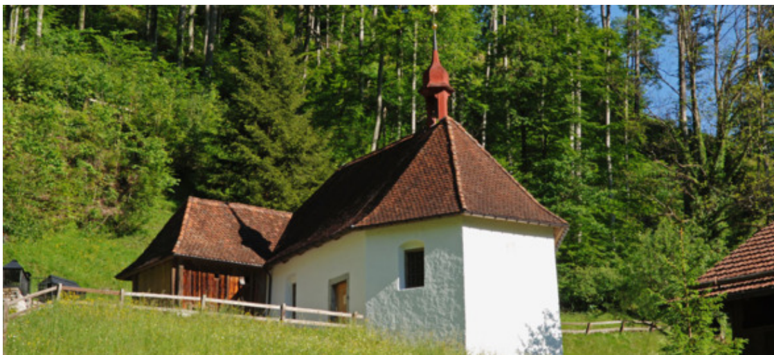
Скит Клауса с часовней, построенной крестьянами.

Николас не совершал чудес, не исцелял больных, не пророчествовал. Он внимательно выслушивал беды того или иного паломника, давал умные советы.