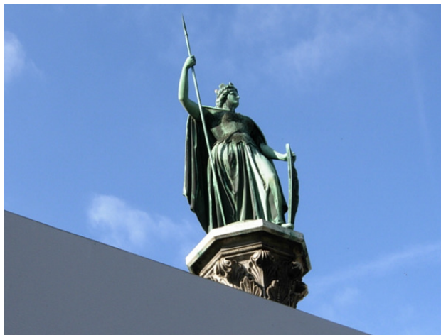
Берн. Мать Гельвеция