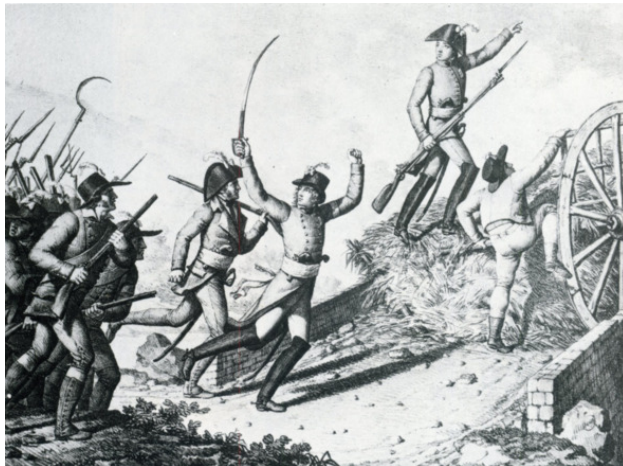
Лескюр и Лярошжаклен на мосту Пон де Врине

ружье и саблю, он один идет на мост, за ним никого нет. Он зовет крестьян в атаку, подымается только один человек! Но тут подъезжает Лярошжаклен и Форест, они спешиваются и бегут на мост. На мосту уже четыре человека, это оказалось достаточно для порыва, и вот уже целая толпа атакующих бежит вперед. Мост взят! Конница под командованием Шарля де Боншампа перешла реку в брод. Республиканцы, теснимые со всех сторон, отступают за городские стены.