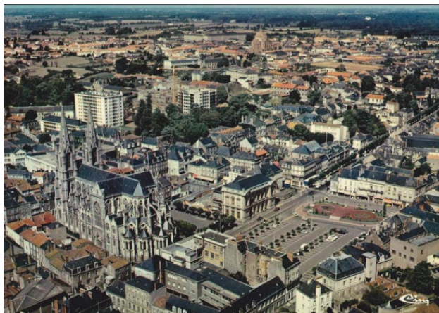
город Шоле сегодня