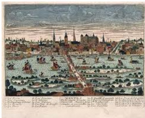
город Нант на гравюре XVIII века

24 июня взят Ансени, вандейцы подходят к Нанту. Стоит отметить, что городские укрепления Нанта были демонтированы между 1760 и 1780 годами, поэтому было решено атаковать сразу с нескольких сторон. Дата атаки была назначена на 29 июня.