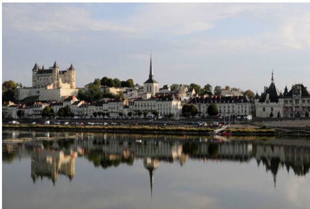
город Сомюр сегодня

15 дней спустя, наша героиня участвует во взятии Сомюра, причем сражается в составе кавалерии, а не пехоты, атакуя в числе двухсот всадников со стороны Сен-Флорена, что заняли мост Фушар, выбив оттуда, превосходящие силы республиканцев.