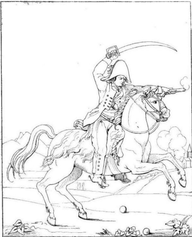
иллюстрация из мемуаров Рене изданных в 1814 году