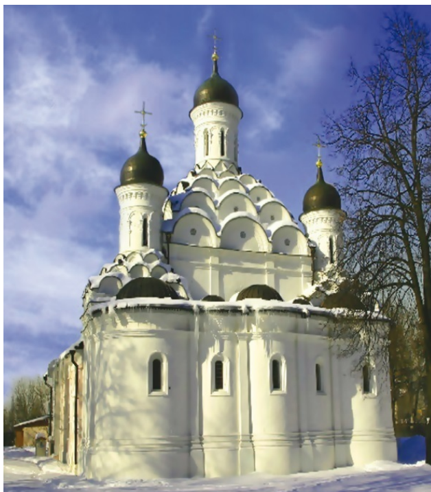
Церковь Троицы Живоначальной в Хорошеве на Москве-реке. 1598 г.

Любой человек, живущий или работающий в Москве в наше время, скажет, что это огромный город, в котором современные дома стоят вперемежку со старинными. Еще добавит, что в Москве постоянные транспортные пробки, все страшно дорого, а люди носятся как сумасшедшие. При этом все понимают, что если какому-нибудь москвичу предложить переехать в маленький, тихий и неторопливый городок, то он, скорее всего, со смехом откажется. Почему?