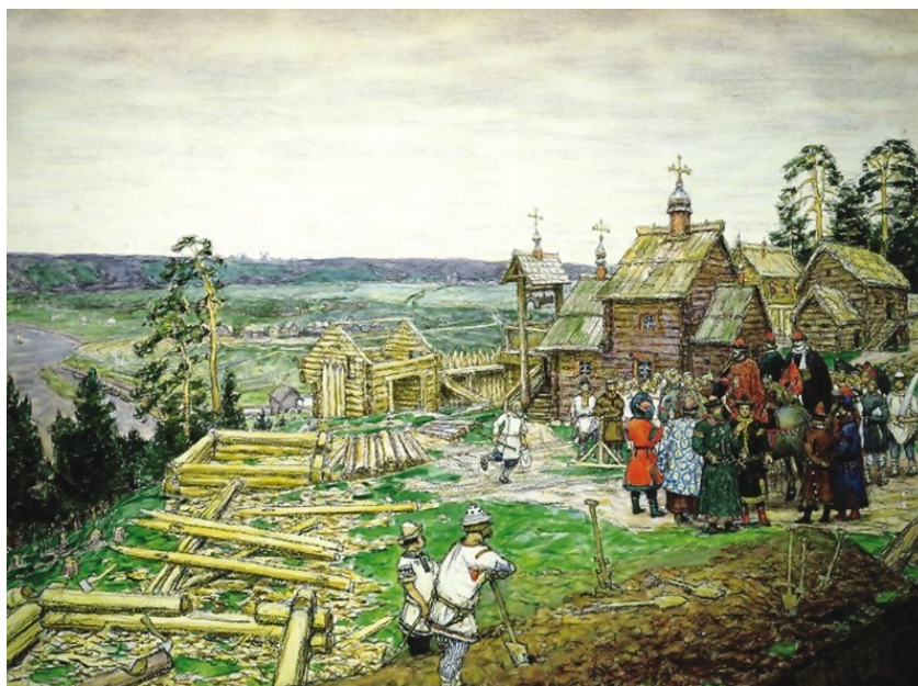
А. Васнецов. Основание Москвы

Итак, как мы помним, поселок Москва образовался примерно на полпути между Новгородом-Северским и Владимиром. Но, оказывается, дороги, которые связывали в XII веке другие российские города, тоже могли проходить через Москву. Посмотрите на любую современную карту Европейской части России. Можно открыть ее на экране компьютера, отыс-