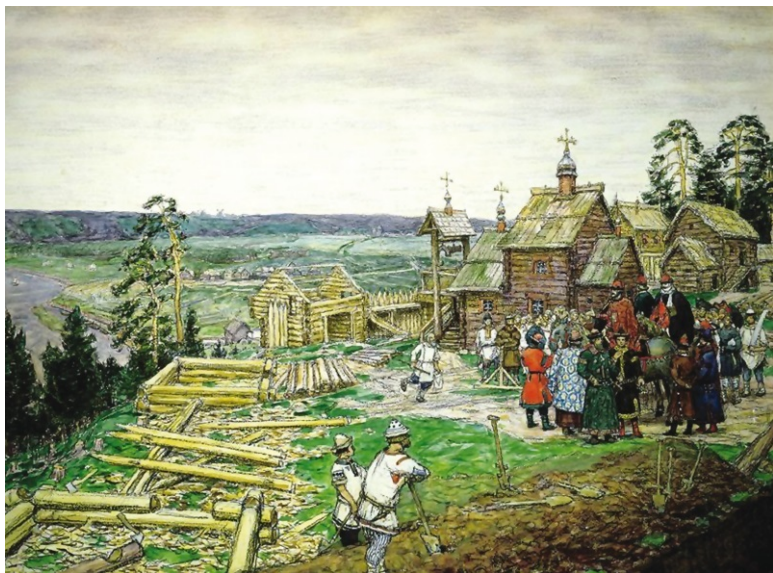
А. Васнецов. Основание Москвы

В результате пир – «обед силен» – удался на славу. Встреча князей в Москве произошла в церковный праздник Рождества Богородицы 8 сентября 1147 года. Вот эту-то дату и считают условным «рождением» города.