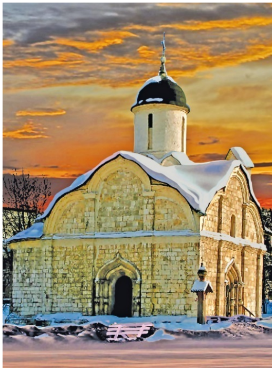
Церковь мученика Трифона в Напрудном. XVI в.

город, Муром, Суздаль, Смоленск, Рязань, Ростов Великий и некоторые другие на сто, двести, а то и триста лет старше столицы. Однако почему-то младшая Москва стала главным городом и мегаполисом, а более древние остались относительно небольшими, некоторые же из них вообще превратились в поселки. Почему так получилось?