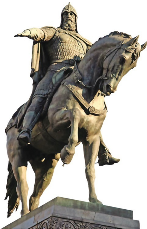
Памятник Юрию Долгорукому

Несмотря на перевод, в этой записи многое остается непонятным. Кто такие Юрий и Святослав? Что такое пардус? Что значит «на Похвалу Святой Богородице», и, наконец, что это за «обед силен»? Попробуем разобраться.