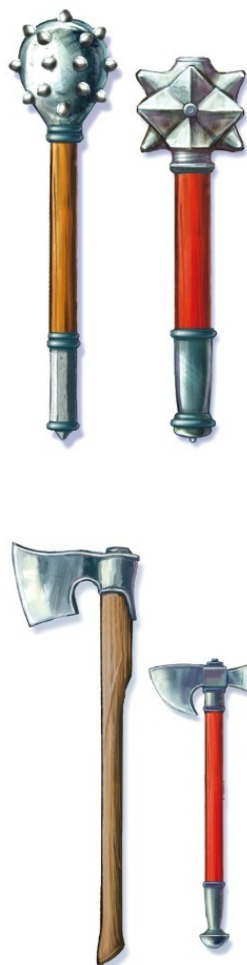
оружие монголов: копья, булавы, топоры

Это войско пожирало и уничтожало все, что ему попадалось на пути. Каждый человек, женщина или ребенок становились беспомощными жертвами неумолимых воинов. Всякое сопротивление каралось смертью, всякая покорность влекла за собой тяжелое рабство.