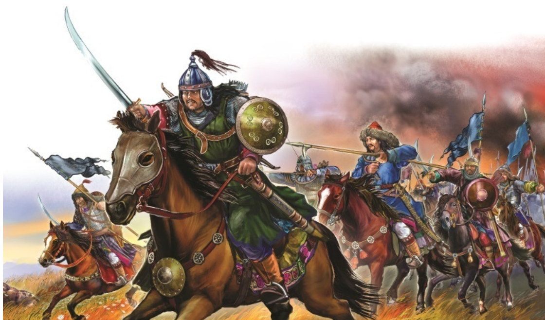
Конница атаковала фланги противника

Вплоть до XIII века о монголах, затерянных в глубинах Азии, почти никто не слыхивал. И вот внезапно они создают державу, равной которой по величине и могуществу еще не бывало в истории. Ее основал «Потрясатель вселенной» Чингисхан (1186–1227). За сорок лет непрерывных войн на территории от Желтого моря до моря Черного Чингисхан подчинил себе сотни народов. Постоянное войско его насчитывало 120 тысяч человек, а в случае необходимости он мог выставить 300-тысячную армию.