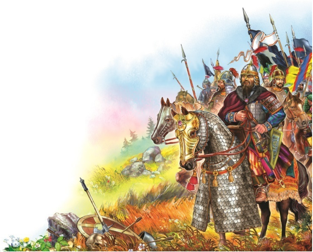
Монгольские воины Чингисхана

требительным в исторической литературе. Так мы обозначаем государство, существовавшее в XIII–XV веках на территории современной России, с центром на нижней Волге.