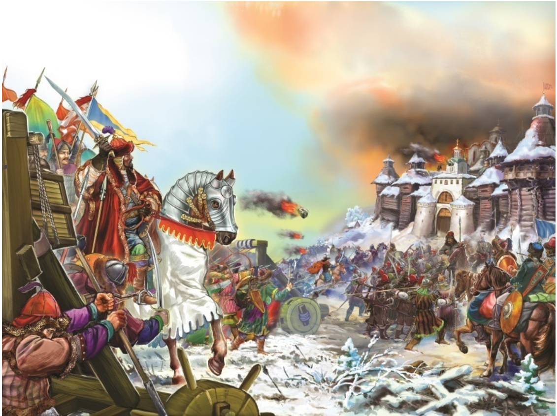
Осада Киева в 1240 году войском Батыея

Разорив Северную Русь, орда отхлынула в половецкие земли. Но через два года началось новое наступление, уже на южнорусские княжества. Не встречая серьезного сопротивления, монголы по отдельности разбивали полки удельных князей. Окружив Киев, Батый стал громить его стены осадными орудиями. Киевляне защищались отчаянно и храбростью своей изумили самого Батыея. Наконец стены обрушились, и монголы ворвались в город. Несколько дней продолжался разгром Киева: прекрасный город, «мать городов русских», был обращен в груды развалин, чтобы никогда более не восстать в прежнем величии и красоте. С этого времени Киев утратил свое исключительное значение на Руси и стал в ряд прочих удельных городов. Все русские удельные князья признали верховную власть Батыея и монгольского великого хана.