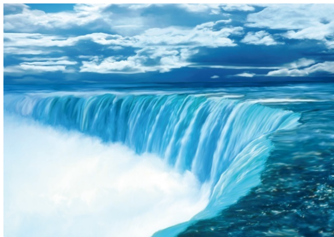
Ниагарский водопад – одно из чудес природы

Как известно, вода камень точит. Падающая вода как гигантским рашпилем грызет откос, в результате чего граница падения воды ежегодно немного сдвигается вверх по течению. За тысячи лет водопад «добрался» почти до середины Ниагары. Местные власти решили, что такое «уползание» водопада следует остановить, и с помощью инженеров-гидротехников отвели часть потока в подземные трубы. Теперь Ниагара стала регулируемой, сезонный избыток воды можно без вреда для скал сбрасывать вниз. Энергия потока не пропадает даром. Она вращает турбины местной электростанции.