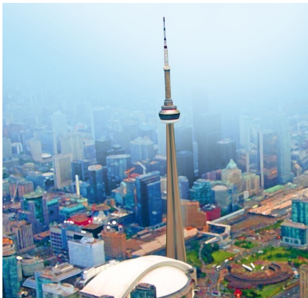
Телебашня в Торонто

смелости хватит. Самые решительные могут подняться еще выше, на верхнюю обзорную площадку Спейс Дэк. От земли ее основание поднято на 447 м.