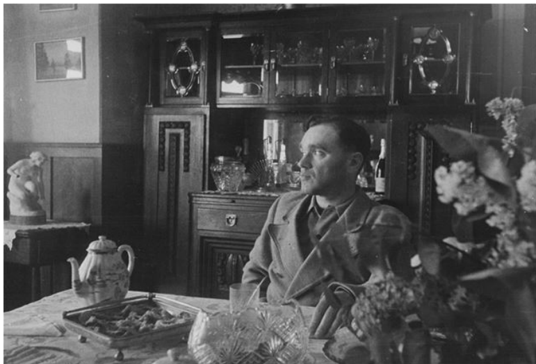
А.С. Яковлев в домашней обстановке.

Думаю, что именно такие воспоминания по мелким, на первый взгляд, штрихам помогут составить представление о человеке, его внешности, характере, присущих ему особенностях и влиянии на ход исторических событий.