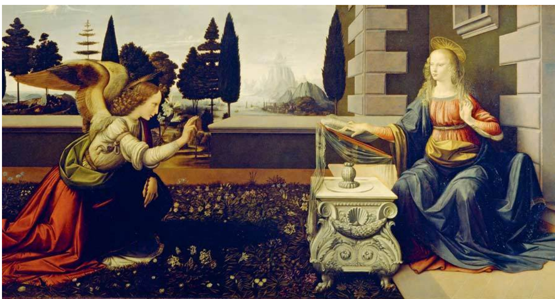
Леонардо да Винчи. Благовещение. Флоренция, галерея Уффици

– Радуйся, Благодатная, Господь с Тобою!