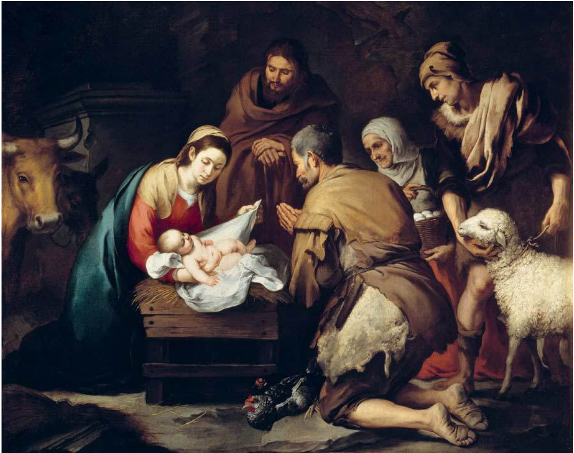
Бартоломе Эстебан Мурильо. Поклонение пастухов. Мадрид, музей Прадо

Ночью пастухи увидели перед собой Ангела во всём блеске небесного сияния. Они испугались, но Ангел сказал им: «Я возвещаю вам великую радость для всего Израиля. Этой ночью в городе Давидовом родился Христос Спаситель. Вы узнаете Его, найдя Младенца, обвитого пеленами и лежащего в яслях».