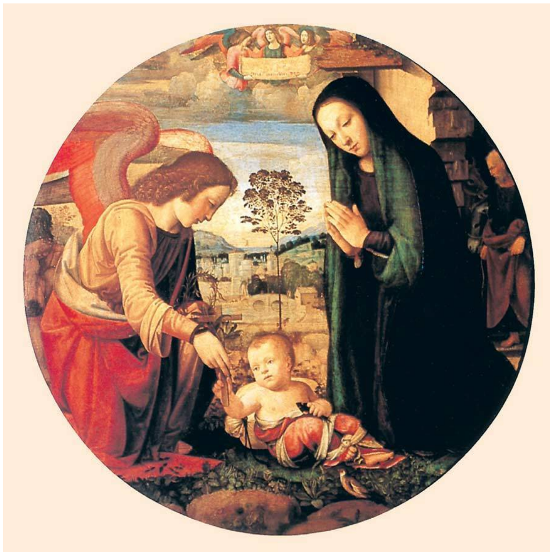
Мариотто Альбертинелли. Поклонение Младенцу с ангелом. Флоренция, палаццо Питти, галерея Палатин

Скрылось солнце за горами, Южной ночи мгла Над святою Палестиной Тихо поплыла. Тишь и сумрак тёплой ночи Навевали сны, И глядели Божьи очи — Звёзды с вышины. Словно в думу погружённый, Неподвижно-нем Спал и город утомлённый, Мирный Вифлеем.