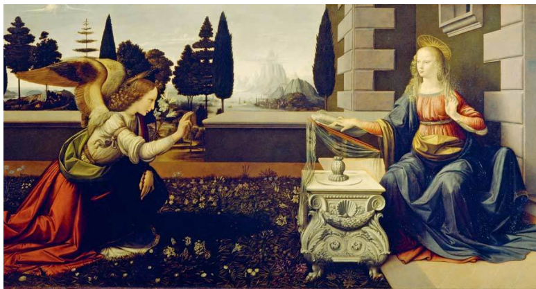
Леонардо да Винчи. Благовещение. Флоренция, галерея Уффици

– Радуйся, Благодатная, Господь с Тобою!