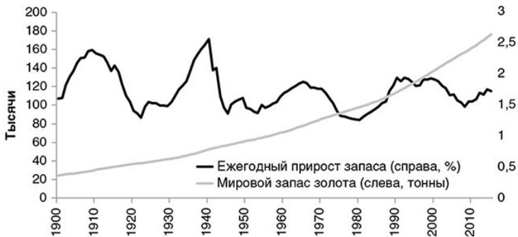
Рис. 1. Мировой запас золота и размер ежегодного прироста 15

Чтобы лучше понять отличие золота о любого потребительского товара, давайте представим, какой эффект производило бы резкое повышение спроса, ведущее к росту цен и удвоению годового производства. В случае потребительских товаров удвоенный приток быстро превзойдет объем имеющегося запаса, в результате чего цены рухнут, а держатели резервов потеряют свои вложения. Что касается золота, то скачок цен вследствие удвоения годового производства будет незначительным, то есть с 1,5 до 3 процентов. При сохранении новых объемов производства запасы будут расти быстрее, что сделает дальнейшие повышения менее существенными. Но для золотодобычи такой сценарий неприемлем, ее