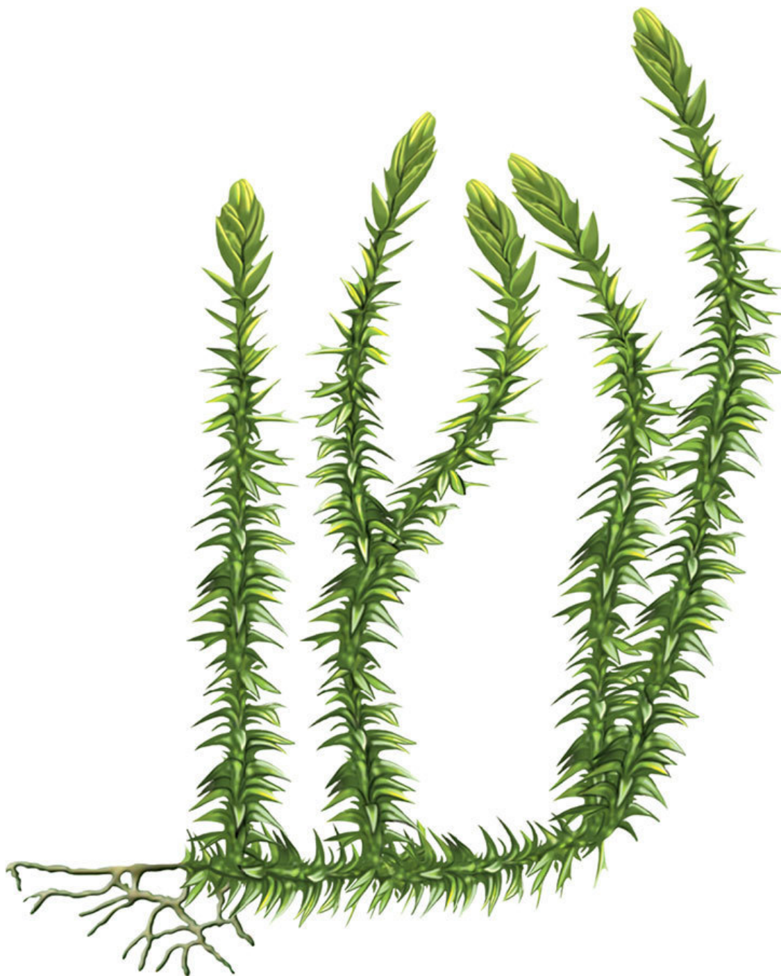
Веточки плаунов похожи на маленькие елочки

На нашей планете около тысячи видов плаунов. На территории России встречается всего пять. Людям от плаунов прок небольшой. В старину споры плаунов, высыпавшиеся из их колосков, использовали в качестве детской присыпки. В спорах много жира, поэтому их можно использовать для изготовления миниатюрных фейерверков. Попав в пламя, споры сгорают крошечными искорками без дыма и копоти. Спорами плаунов посыпают формы при литье из металла изделий сложной формы.