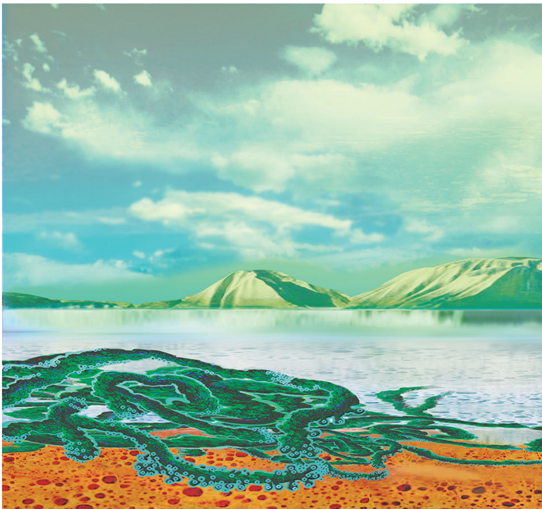
Древние водоросли осваивают сушу

Псилофиты вымерли, а вот плауны живы до сих пор. Их внешний облик удивительно напоминает древних первопроходцев суши. Как же карлики-плауны смогли выжить среди лесного разнотравья? Почему другие растения не задушили, не закрыли их своими листьями? Оказывается, плауны пускают в ход химическое оружие! Они выделяют вещества, губительно влияющие на другие растения. Плауны содержат вещества, похожие по строению на яд кураре. Постепенно разрастаясь, плети плауна часто образуют кольцо. Оно ширится, тесня травы и мхи. За такое, на первый взгляд, таинственное свойство на Руси плауны называли колдунниками.