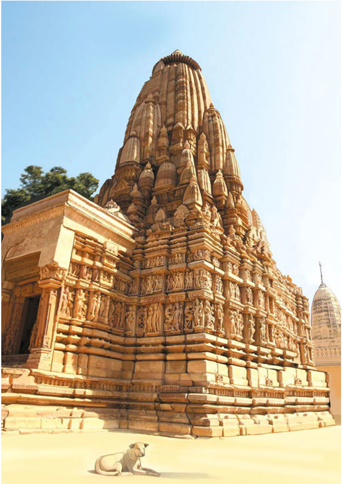
Храм Лакимана из храмового комплекса Кхаджурахо

Другой важный бог индуизма – Шива. Его изображают и в виде странствующего аскета, чье тело покрыто пеплом, и йогом, который восседает на вершине горы Кайлас и с помощью третьего глаза обзирает скрытое от взоров. В наказание за ссору с Брахмой Шива приобрел вид чудовища с торчащими клыками. Супруга Шивы – красавица Парвати, а его вахана – бык Нанди. Шива является богом танца – в процессе танца он создает вселенную, дарит ей свой