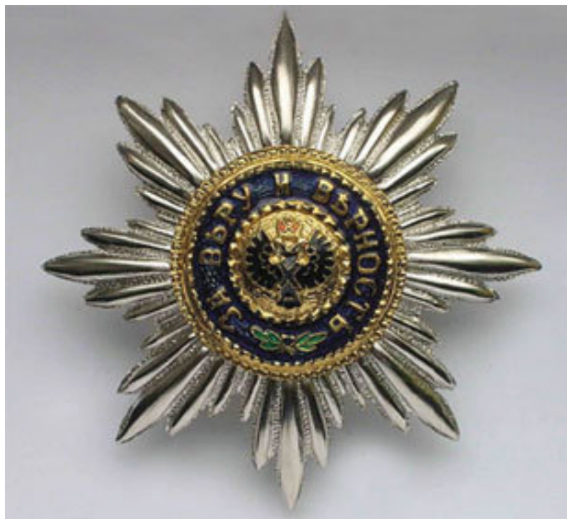
Звезда к ордену