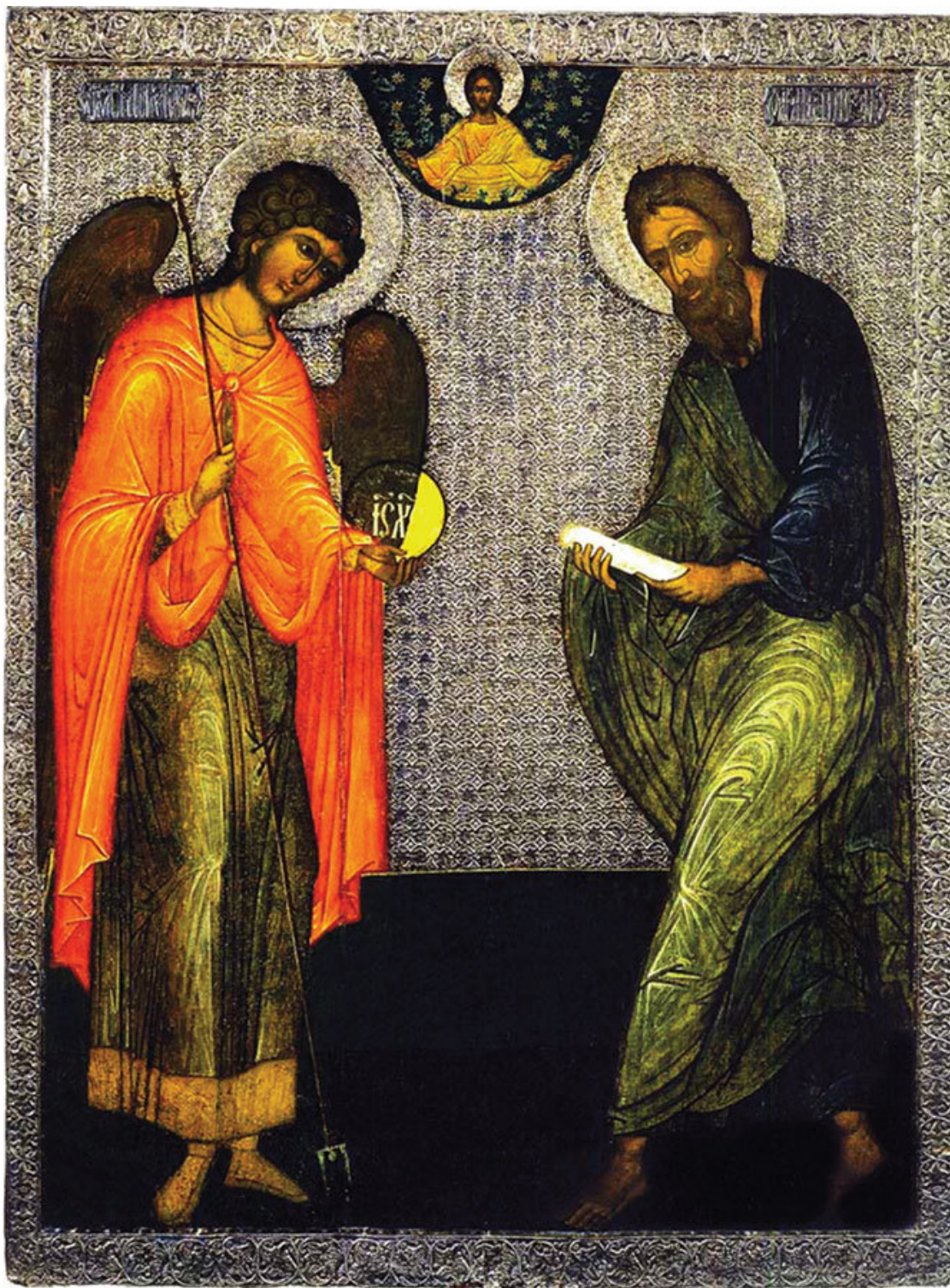
«Апостол Андрей Первозванный с Архангелом Михаилом», икона XVI в.