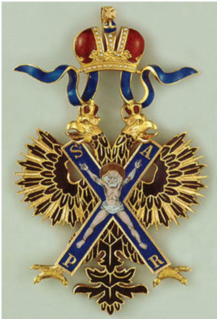
Орден Андрея Первозванного

носили на голубой шелковой ленте. Великие князья получали его при крещении. Отсюда пошел современный обычай перевязывать младенцев мужского пола лентой голубого цвета.