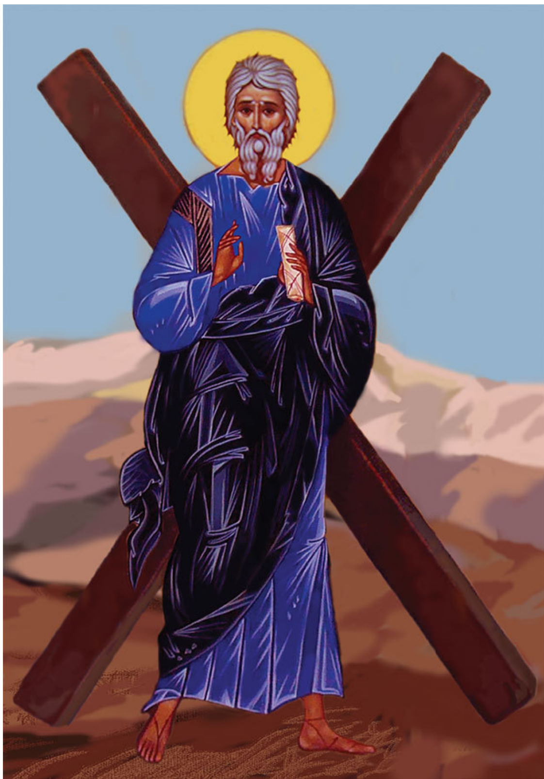
Апостола Андрея часто изображают на фоне косога креста

На знаке ордена Андрея Первозванного изображен сам распятый святой. На концах креста золотые буквы: SAPR (Sanctus Andreas Patronus Russiae – «Святой Андрей Покровитель России»). Выше – двуглавый российский орел, увенчанный тремя коронами. На оборотной стороне знака, на груди орла, начертан девиз ордена: «За Веру и Верность». В старину орден