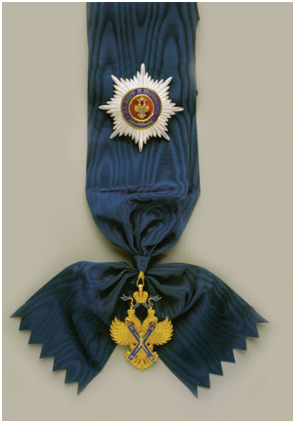
Звезда с орденом на ленте

После революции в 1917 году орден Андрея Первозванного был отменен. Однако прошло время, и 1 июля 1998 года он был восстановлен и с тех пор остается одним из высших орденов России.