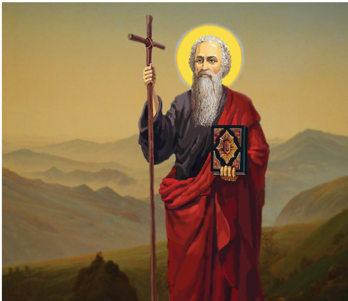
Странствия Андрея Первозванного

Поэтому, выбирая Андрея Первозванного покровителем для своего ордена, Петр укреплял позиции России как европейской страны. К тому же Петру нравился образ этого святого, который большую часть своей жизни провел в странствиях и считался покровителем моряков.