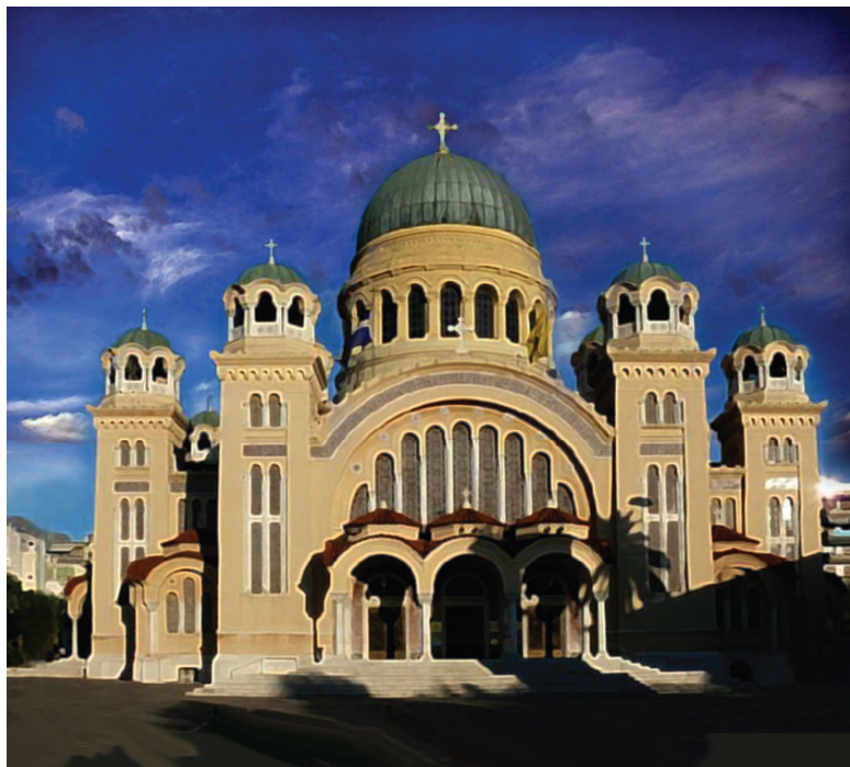
Храм Андрея Первозванного, г. Патры, Греция