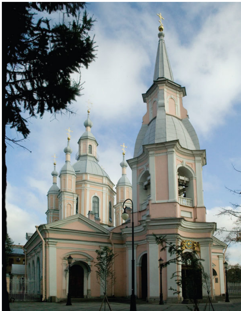
Андреевский собор, Санкт-Петербург