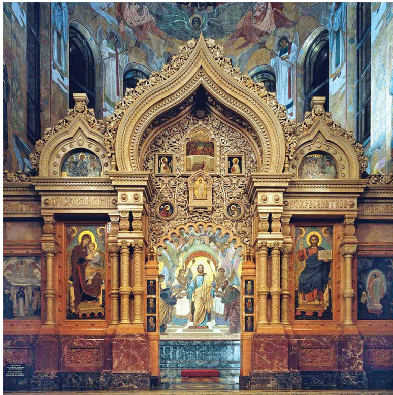
Иконостас храма «Спас-на-Крови», Санкт-Петербург