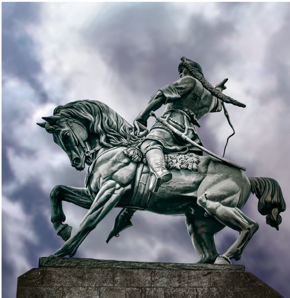
Памятник Салавату Юлаеву в Уфе

принял на себя Александр Суворов. Предводитель восставших был схвачен и закончил свои дни в далекой балтийской крепости Рогервик.