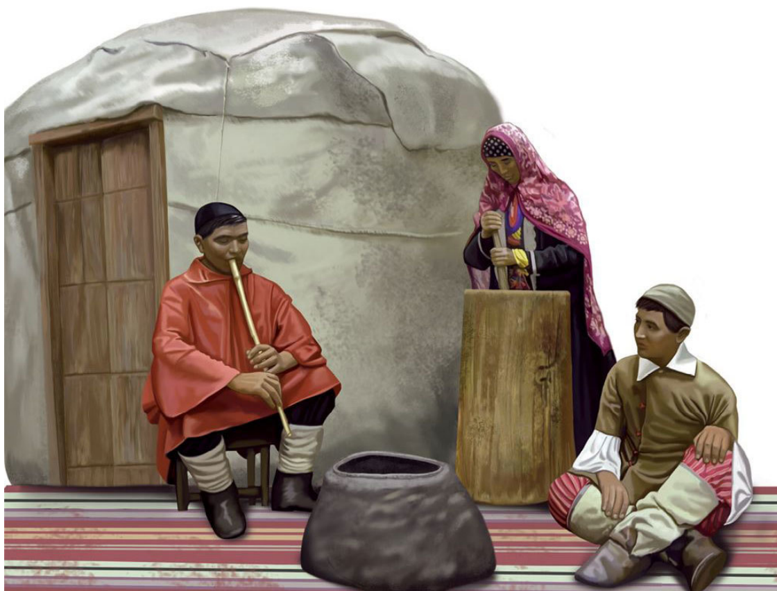
Традиционное жилище башкир

Салават Юлаев немного напоминал героя народного эпоса юго-восточных башкир «Урал-батыр». Уральские горы появились в названии поэмы не случайно. Люди стали обживать эти места очень давно. Об этом говорят наскальные рисунки, сделанные красной охрой в пещере Шульган-Таш. Им не менее пятнадцати тысяч лет. Именно здесь, на границе двух континентов – Европы и Азии, на Южном Урале, и произошло формирование башкирского народа. Историки говорят, что это случилось во второй половине I тысячелетия нашей эры. Тогда несколько племен объединились под именем «Башкорт». На это объединение намекает стилизованное изображение цветка из семи лепестков на гербе Республики Башкортостан. Историки предполагают, что Башкортом звали военачальника, который стал вождем объединенного военно-политического союза.