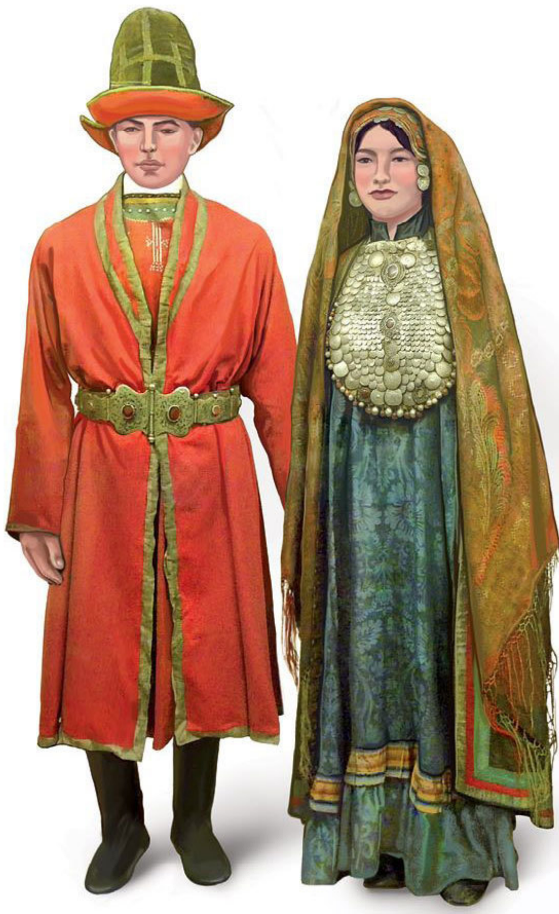
Национальная одежда башкир