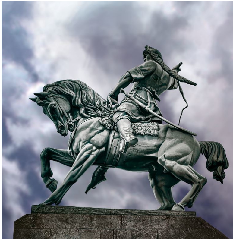
Памятник Салавату Юлаеву в Уфе

Надо отметить, что Салават и его отряды сражались не с русскими людьми, а с царской государственной машиной. Вот только один факт, который красноречиво об этом говорит. Когда войска башкир окружили Катавский завод, Сала-