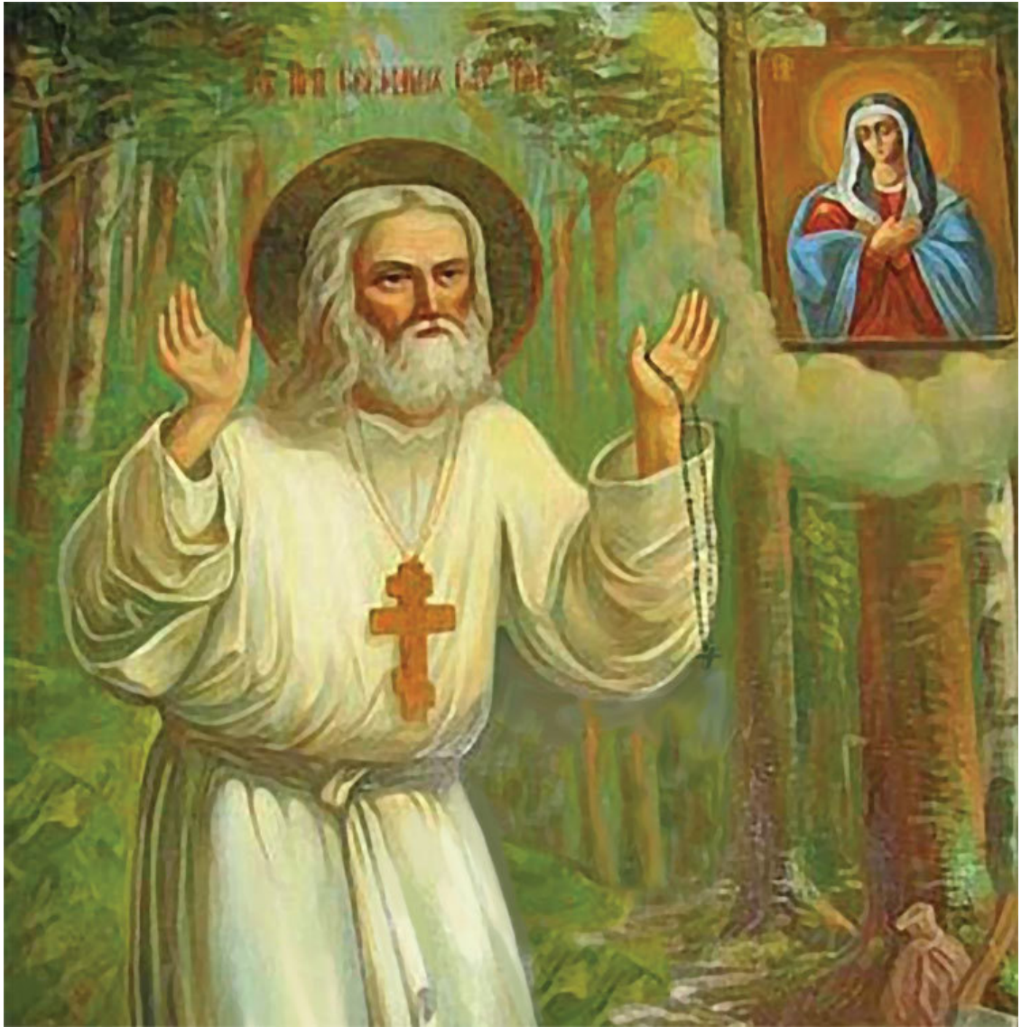
Преподобный Серафим Саровский

Монахи вели жизнь, не похожую на жизнь обычных людей. Они проводили дни в молитвах, не имели семьи и личного имущества, вместе ели, соблюдали длительные посты. Жизнь монахов была в большинстве нелегка и исполнена трудов.