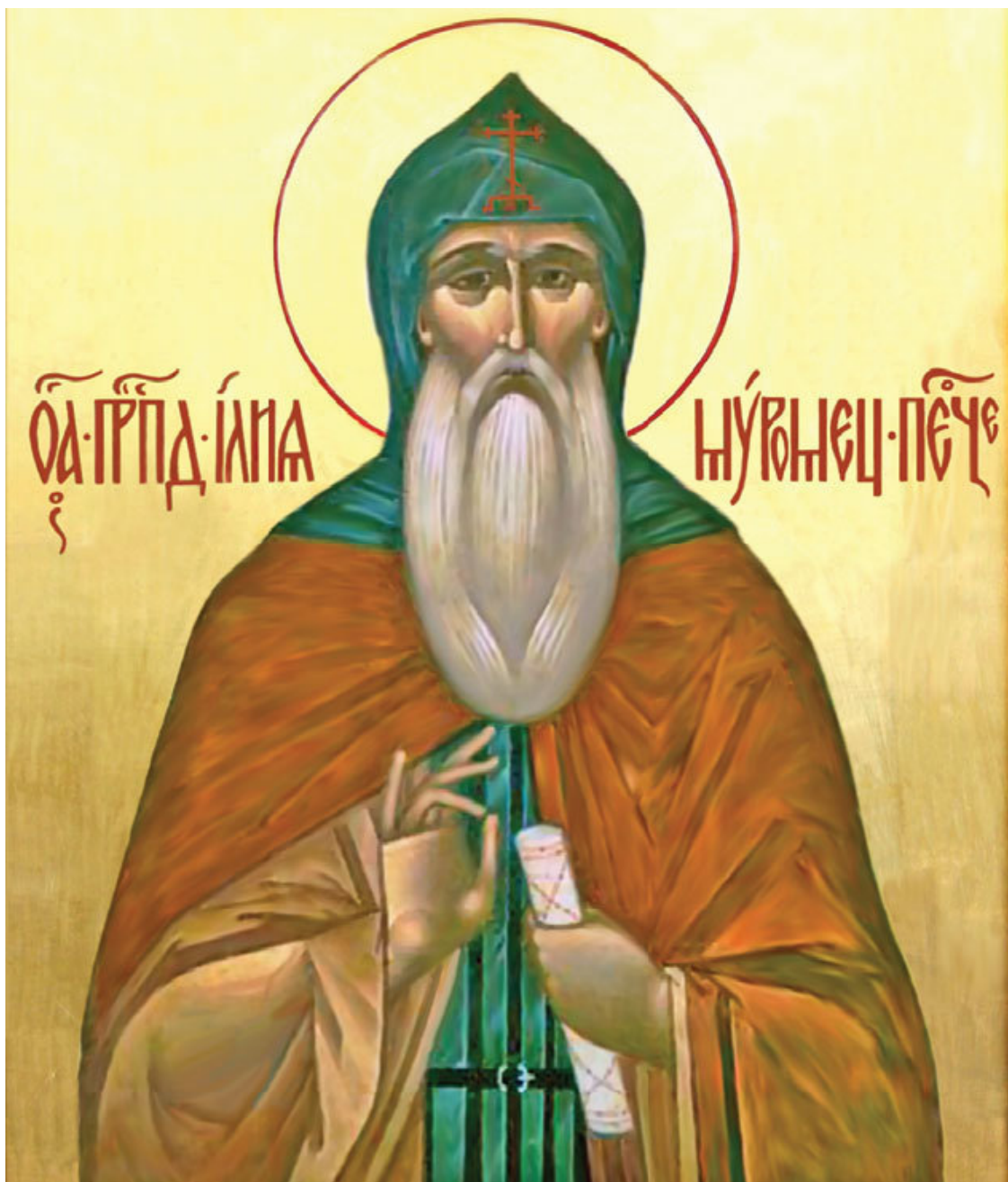
Святой преподобный Илья Муромец Печерский