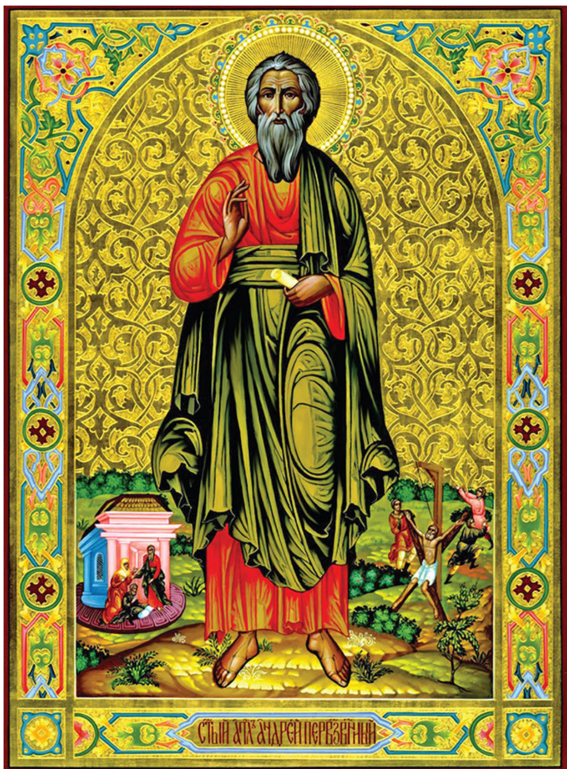
Апостол святой Андрей Первозванный