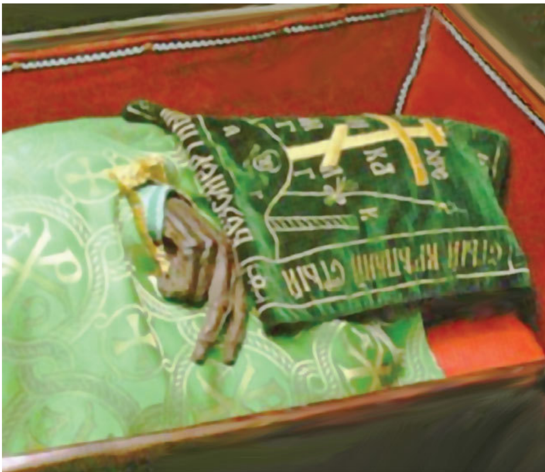
Мощи Ильи Муромца

Когда число монахов, живущих в пещерах, вновь увеличилось, киевский князь Изяслав Ярославович пожаловал братии всю гору, которую они выбрали местом своего уединения. На ее вершине была построена церковь, которая и положила начало монастырю. Он был назван Печерским (то есть Пещерским). Пещеры с тех пор стали играть роль склепов, куда помещали останки монахов, окончивших свой земной путь. Для этого в стенах пещер делались небольшие ниши глубиной до двух метров. В них помещали тело усопшего, прикрывали его деревянным щитом или замуровывали. Так продолжалось сотни лет. Наверху, на воздухе и солнце рос и креп монастырь, а под ним все больше и больше становилось захоронений монахов.