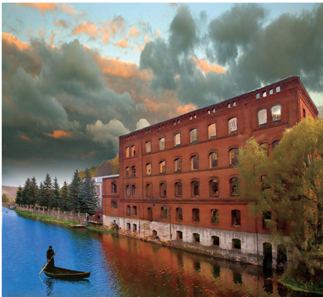
Старая водяная мельница на Ворголе