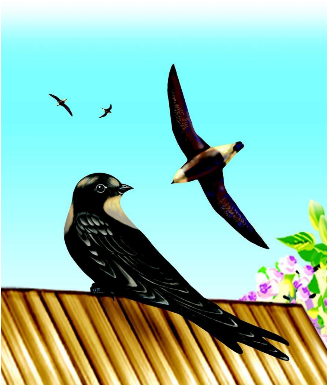
Колючехвостые стрижи – рекордсмены в мире пернатых

Сокола-сапсана можно назвать «воздушным гепардом». Средняя скорость его полета не очень велика – около 60 км/час. Но вот что происходит, когда сапсан видит добычу, например пролетающего неподалеку сизого голубя. Сокол легко догоняет жертву, поднимается над ней и пикирует сверху. Скорость полета сапсана в этот момент может достигать 100 м/с, что соответствует 300 км/час. Ни одна птица в мире не может лететь быстрее. Огромная скорость нужна хищнику не только для того, чтобы настигнуть жертву, но и для мощности удара. Сапсан бьет добычу когтями задних пальцев лап. От удара у голубя может переломиться крыло, а у утки – отлететь голова.