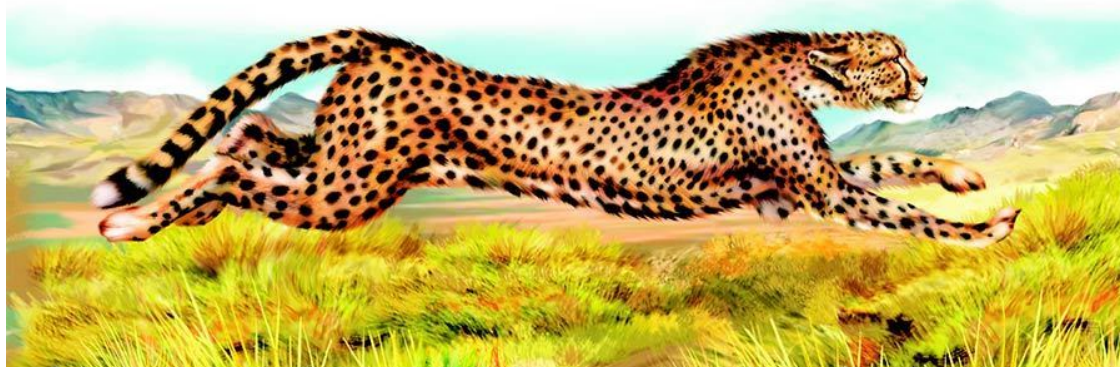
Гепард в погоне за добычей

Некоторые животные добывают себе пропитание исключительно благодаря умению быстро передвигаться в пространстве. Самый яркий пример такого охотника – это, несомненно, гепард. В семействе кошачьих он далеко не самый крупный и сильный зверь.