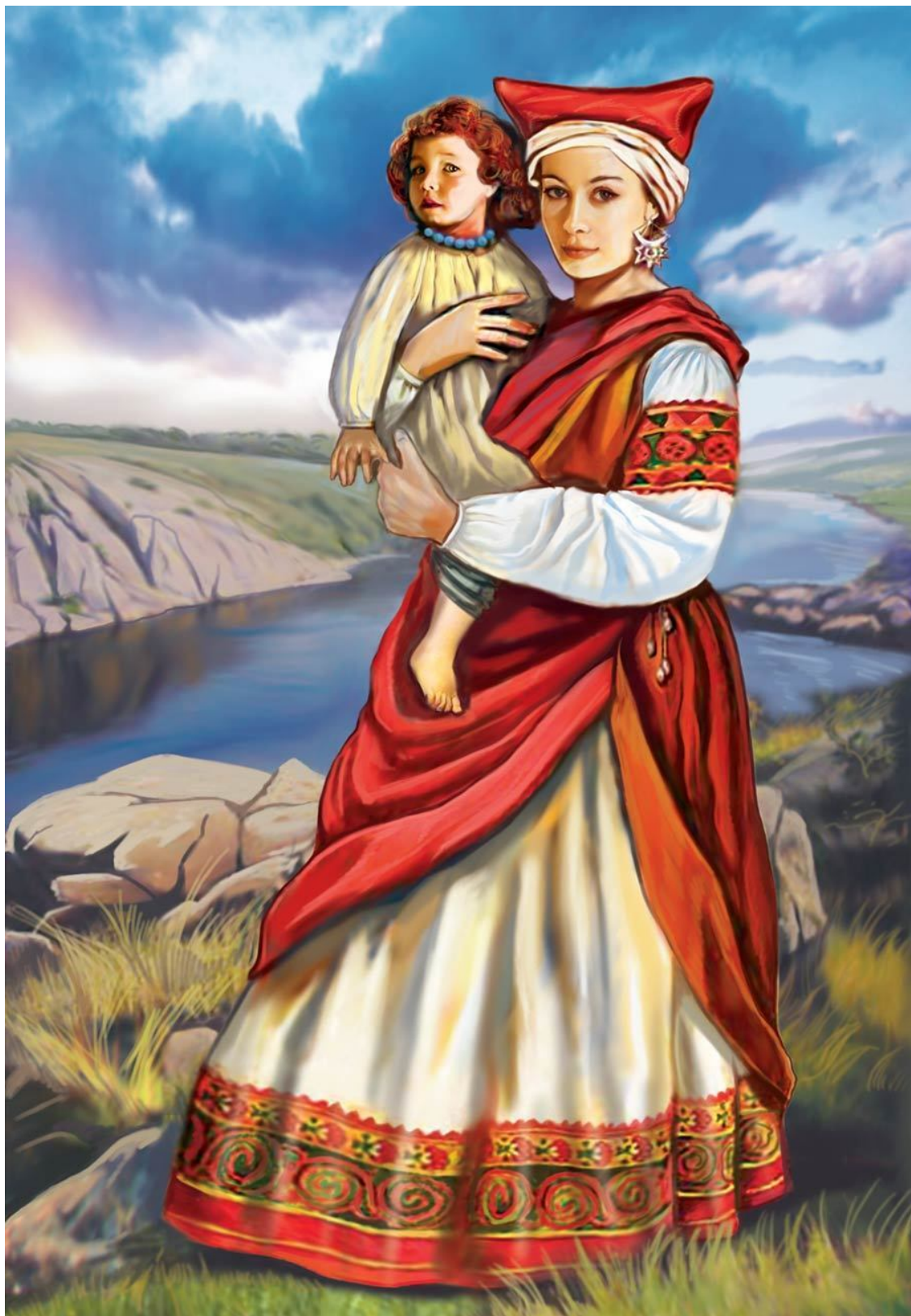
Мать с младенцем из племени антов

Об аварях, которых на Руси называли обрами, так рассказывается в замечательной русской летописи «Повести временных лет»: «Обры воевали и против славян, и притесняли дулебов – также славян, и творили насилие женам дулебским: бывало, когда поедет обрин, то не позволял запрячь коня или вола, но приказывал впрячь в телегу трех, четырех или пять жен