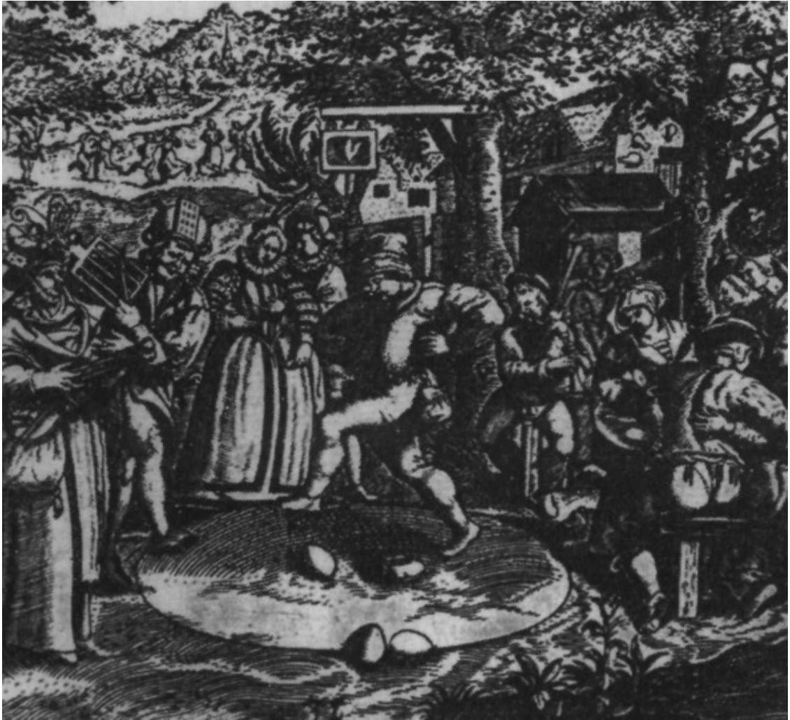
Пасхальный танец с яйцами (Eiertanz) в Германии, иллюстрация XVI века

Пасха (с иврита – песах, с арамейского языка «пасха») – один из главных праздников в иудейской и христианской религиях. Однако понятие Пасхи постоянно менялось в истории в зависимости от тех или иных событий. В 3—2-м тысячелетии до н. э. Пасха была весенним праздником древнееврейских кочевых скотоводческих племён, а само слово «песах» обозначало умиловительную жертву (из первенцев скота весеннего отёла). С завоеванием древними евреями Ханаана-Палестины в 14—13 вв. до н. э. и с переходом их к оседлому земледелию праздник Пасхи соединился с сельскохозяйственным праздником начала жатвы – «мацот» (опресноков – пресного хлеба – мацы, праздник – начинался на второй день Пасхи и продолжался вместе с Пасхой до семи дней, в течение которых при принесении жертв в храме евреи ничего квасного не должны были употреблять в пищу (Исх 12:15—19). Праздник этот постоянно должен был напоминать об освобождении от угнетения и египетского рабства (Лев 23:5,14; Чис 28:16, 25; Втор 16:3,8; Деян 12:3). В 7 в. до н. э. установление Пасхи было приписано богу Яхве (на самом деле иудейским жрецам) и отнесено к моменту исхода евреев из Египта, а празднование было приурочено к 14—21 числу месяца нисана (март – апрель), а слово «песах» у древних евреев стало пониматься как «прохождение», имеется в виду «про-