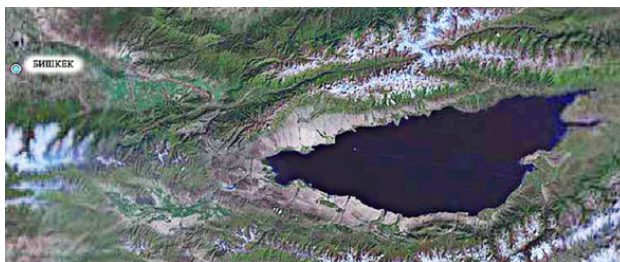
Вид района маршрута из космоса