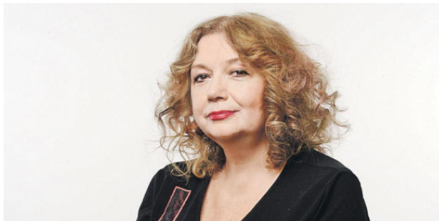
Фото из источника в списке литературы [14]