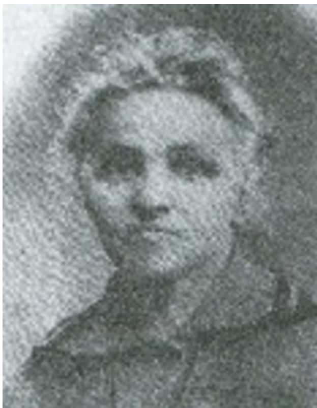
Мириам, жена Йосэфа. Фото из источника в списке литературы [8810]