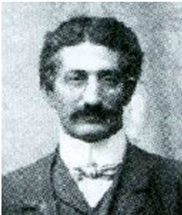
АЙЗЕНШТАДТ Йосэф- Меер. Фото из источника в списке литературы [8810]