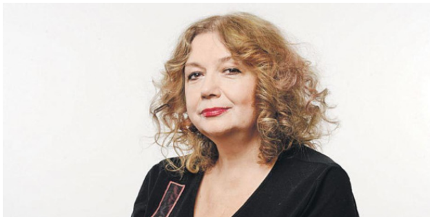
Фото из источника в списке литературы [14]