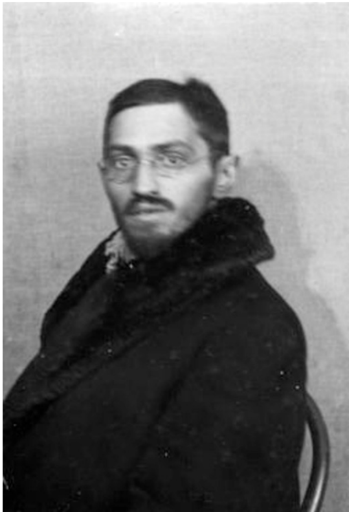
Фото из источника в списке литературы [11]