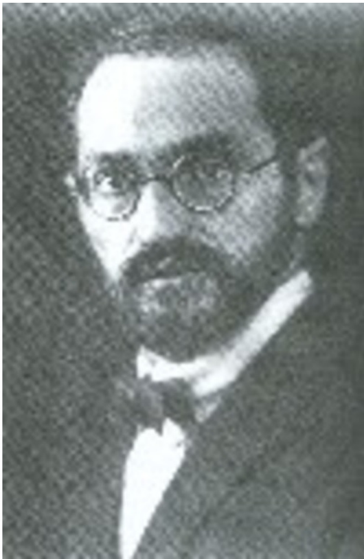
Фото из источника в списке литературы [13]

Александр Розенблюм о Самуиле (Шмуэле) Иосифовиче Айзенштадте