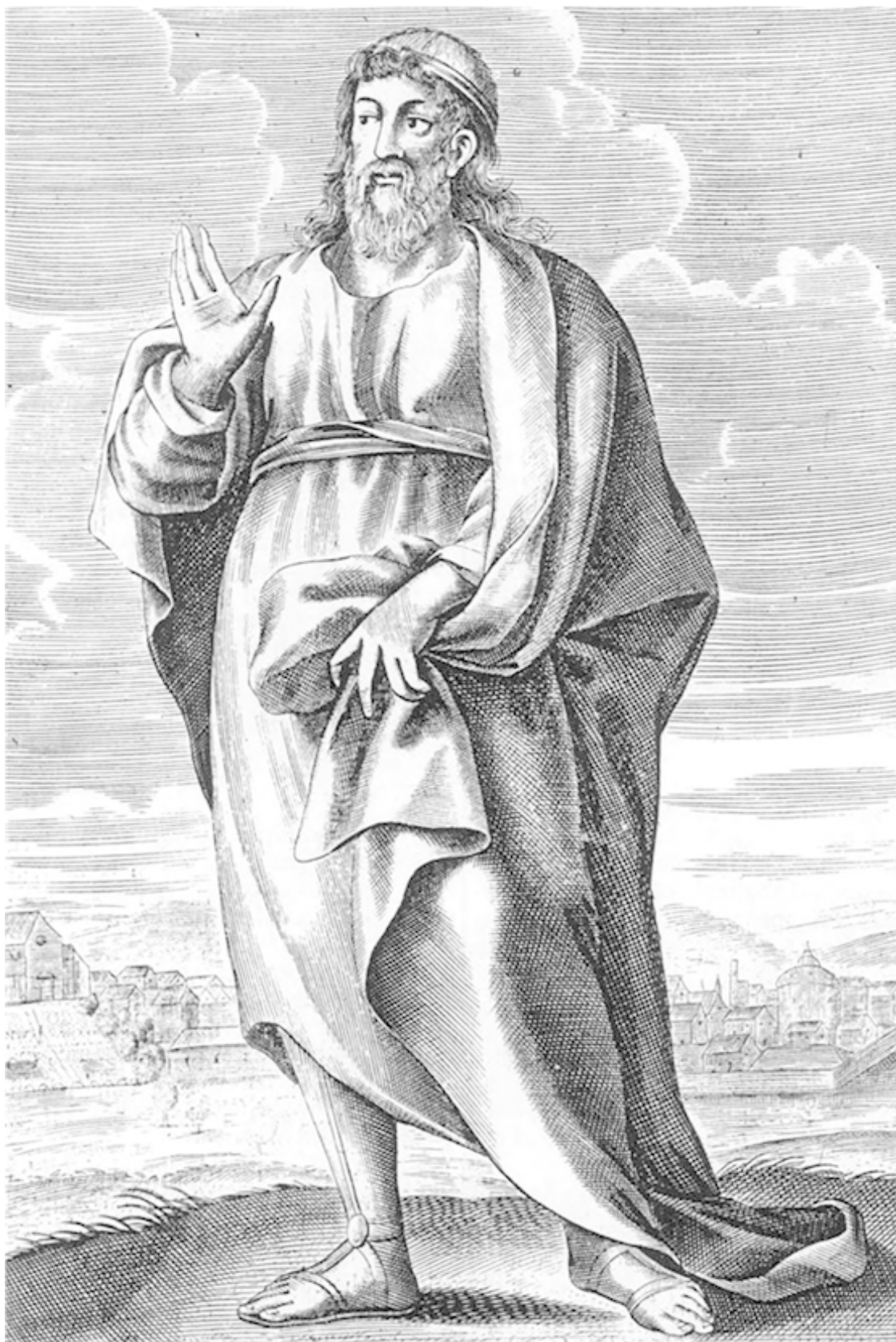
ПЛАТОН 428 (427) – 348 (347) гг. до н. э.