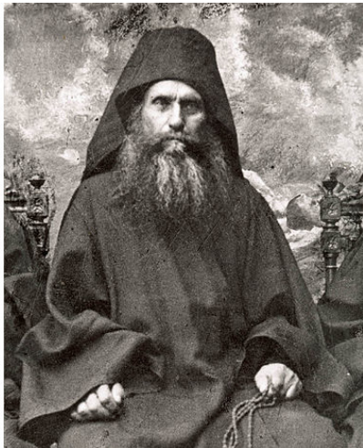
Преподобный Силуан Афонский. Фото 30-е годы XX века.

Монах читает поучения. Чьи, то мне неведомо. Не до поучений. Маслины так и трещат у меня за ушами. Ем, ем. Как вкусно! Наслаждение, а не еда – маслины с чёрным хлебом. Но вот чтец прочитал главу и нас поднимают из-за столов. Меня как по губам ударили. Тарелка с маслинами осталась почти нетронутой. Только ведь начали трапезу и уже подъём. В армии и то время больше давали. Вновь молитва. Спускаемся вниз. Несолоно хлебавши, стою на солнцепёке.