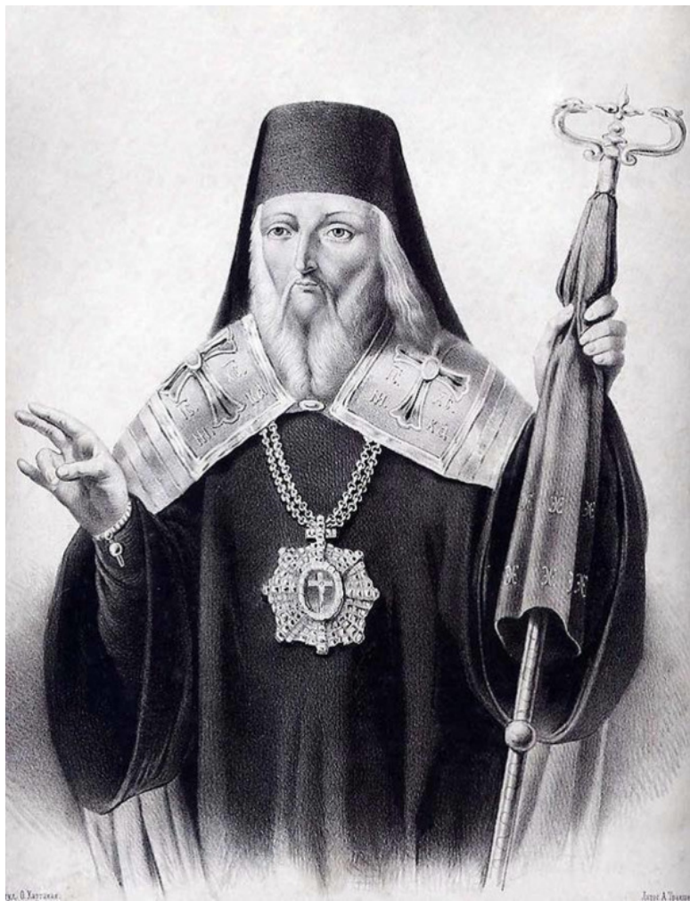
Митрополит Игнатий Мариупольский. Мариупольский