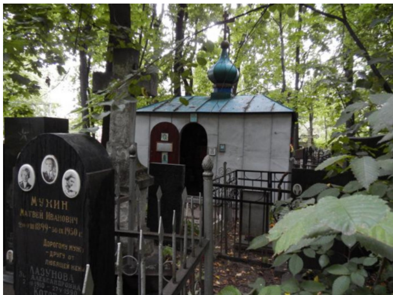
Часовенка схиархимандрита Захарии на Введенском кладбище Москвы. Attribution-ShareAlike 3.0

ставшего таким ещё при жизни и советы игумена Бориса, архимандритов: Наума, Зосимы, Амвросия и многих после них. Это небо и земля. Они не знают, что сказать. Гоняют человека на службы, изучают, подмечают, подстраивают разные ситуации, чтобы человек проявился, а толку никакого. Их советы привели к тому, что мы с мамой остались без крова. А ведь делали всё, как благословил батюшка.