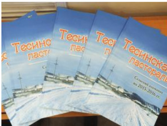
Фото 4. Поступил тираж журнала «Тесинская пастораль»