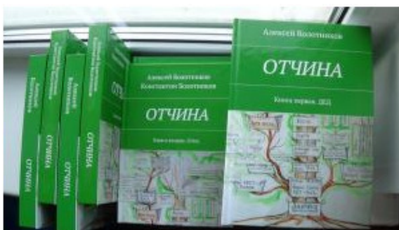
Фото 5. Поступил тираж книги «ОТЧИНА»

«Выйду в свет и тираж... – написал автор в прологе первой книги, как некую мантру на замысленный труд. – Странное испытываю чувство: будто бы не моё это дитя. Будто не со мной происходит. Будто не я вдыхаю запах типографской краски...»