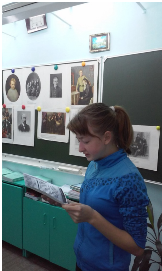
Фото 2. Их путь вспоминали и школьники...