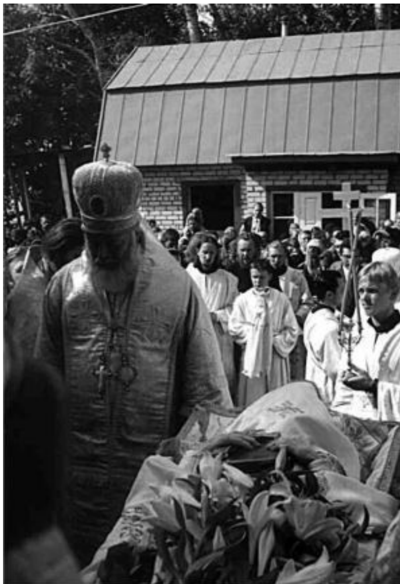
Прощание Владыки Евсевия со старцем Николаем

Тех, кто в эти дни добирался до острова, можно было сразу определить по глазам. Не знаю, как определить и назвать это чувство, но было видно без слов, что свой человек – православный. И путь его к батюшке.