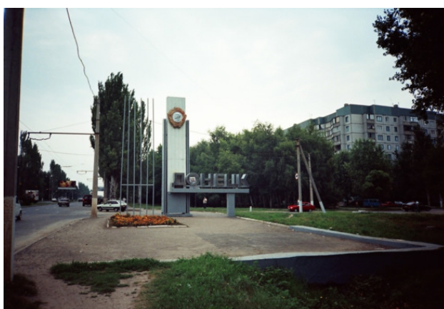
Южная окраина. Въезд в город

363 кв. км занимает столица края, вместе с входящими в Горсовет прилегающими населенными пунктами – 570,72 км. 2 . С востока на запад город протянулся на 55, с севера на юг – на 28 км. Протяжённость улиц Донецка превышает четверть длины экватора, в городе около 60 посёлков. В городе почти 18 тысяч гектаров зеленых насаждений. Жители города 116 национальностей и самого различного вероисповедования проживают в полном согласии между собой (в области—133 национальности, всего на Украине-134). Для выпускников школ в городе действуют более 20 вузов III – IV уровня аккредитации, техникумы, профтехучилища и т. д. В городе действуют 3 театра, филармония, краеведческий и художественный музеи, художественно-выставочный центр «АртДонбасс», Дом художника, индустриально-художественный центр «Изоляция», цирк, цифровой планетарий, аквапарк, дельфинарий «Немо», выставочный центр «Эксподонбасс», самый большой в Украине ботанический сад, музыкальный парк, парк кованных фигур, один из лучших в Европе футбольный стадион «Донбасс Арена», 53 ДК.