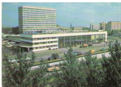
Здание автовокзала «Северный»

снесли, и через два года на месте вокзального комплекса возник 24-этажный дом, выше последнего этажа находится зелёный купол с окнами. Перед этим домом весной 2012 года воздвигли бронзовый памятник князю Александру Невскому. В наших местах когда-то жили половцы, а бабушка князя была половчанкой, это единственная связь князя с нашим краем. В доме 26.10. 2013-го года открыли административно-торговый комплекс «Северный». Ещё два таких высотных дома остались западнее, перед пересечением улицы Артёма с Киевским проспектом. Сам вокзал вместе с переименованием площади в 1989 году перевели за пределы жилых районов. До 2011 года он находился за Киевским проспектом, носил имя – Путиловский (по имени местности рядом с ним, которая в свою очередь получила название от петроградского заводладельца) и исправно обслуживал пассажиров, отправляющихся в близлежащие города, по Украине и ближнее зарубежье. В начале 2-го десятилетия нового века его вновь перенесли на 8 км западнее, название дали – «Западный». За бывшим Путиловским вокзалом расположен аэропорт. Киевский район можно назвать транспортным (ранее назывался Железнодорожным, это первое название района), в этом районе располагались – главная ж.д. станция, аэропорт, автовокзал.