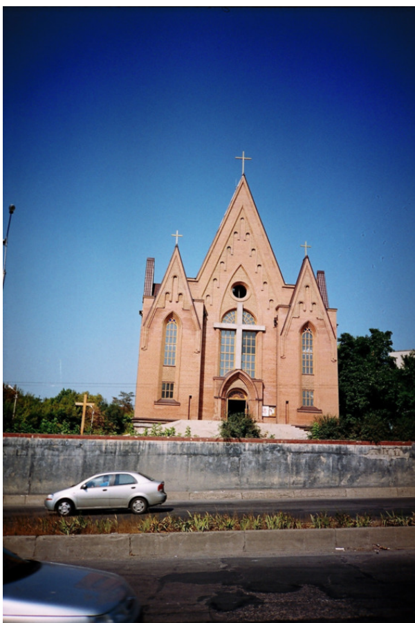
Римско – католическая церковь Святого Иосифа. XXI век.

В области первый женский монастырь на честь чудотворного образа Касперовской иконы Божьей матери Украинской православной церкви возник в окрестностях Макеевки в 1997 г. В Донецке действует женский монастырь на честь Иверской иконы Божьей матери. В Славянском районе в селе Сергеевка действует женский монастырь на честь Сергея Радонежского Горловской епархии Украинской православной церкви.