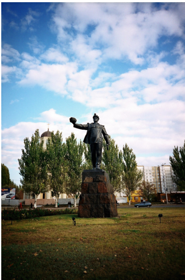
Памятник «Слава шахтерскому труду»