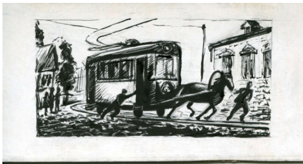
Пробный проезд по трамвайному маршруту

и волов являлись тогда основным транспортом в Юзовке. В начале XX-го века скорость автомобилей в Юзовке не должна была превышать 30 вёрст (около 32 км), что предусматривалось правилами дорожного движения для Екатеринославской губернии (приняты в 1909 г.). В 20-30-е годы прошлого века в Юзовке-Сталино существовал своеобразный автогужевой профсоюз. На его гербе красовались деревянное колесо и лошадиная голова. Называлось это объединением «легковиков, возчиков-дрогаблей и шоферов-одинок». Почему предшественников нынешних таксистов называли «ломовыми извозчиками»? Потому, что у каждого в экипаже находился лом. Если одно из четырёх деревянных колёс выходило из строя, ось колеса вправляли при помощи лома. При «разборках», которые всегда были во все времена, лом также применяли, как современные водители монтировку. Когда появились первые 2040 метров твёрдого дорожного покрытия на Первой линии, начали ходить первые ещё слабосильные автомобили, грузовые и легковые. Во времена войны массовое использование лошадей возобновилось и просуществовало до 60-х годов. Перевозчикам неплохо жилось во все времена. О извозничьей бирже в Макеевке рассказывает Василий Гроссман устами своего героя в написанном им романе «Степан Кольчугин»: «Извозчики люди с достатком – в Юзовку за три рубля соглашались доставить, при настоящей цене – „полтинник“, чтобы не прерывать беседу меж собой».