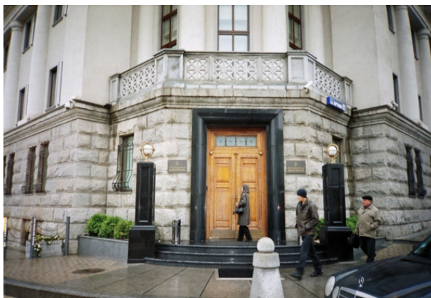
Начало 21-го века. Здание Донгорбанка.