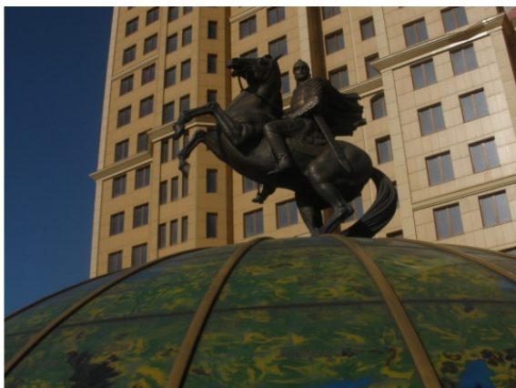
Князь Александр Невский