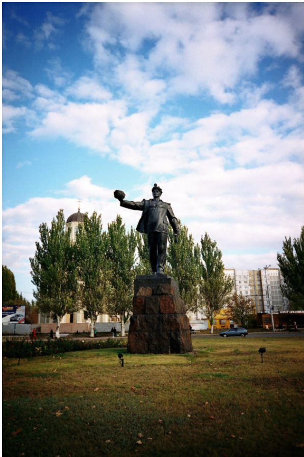
Памятник «Слава шахтерскому труду»

Найти литейщика, который бы взялся выполнить задачу архитекторов, было нелегко. Три формовщика, приглашён-