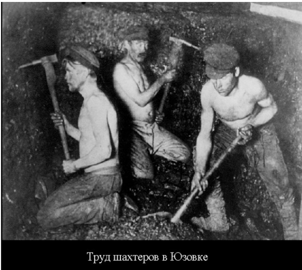
Труд шахтеров в Юзовке

виды оружия запорожских казаков, как доказали учёные, изготовлены из донецкого металла. Поэтому не случайно металлургическую базу создали в таком месте. Селение Александровка к началу промышленного бума относилось к Бахмутскому уезду Екатеринославской губернии. Рождение металлургического завода также произошло в Александровской волости Бахмутского уезда.