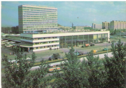
Здание автовокзала «Северный»