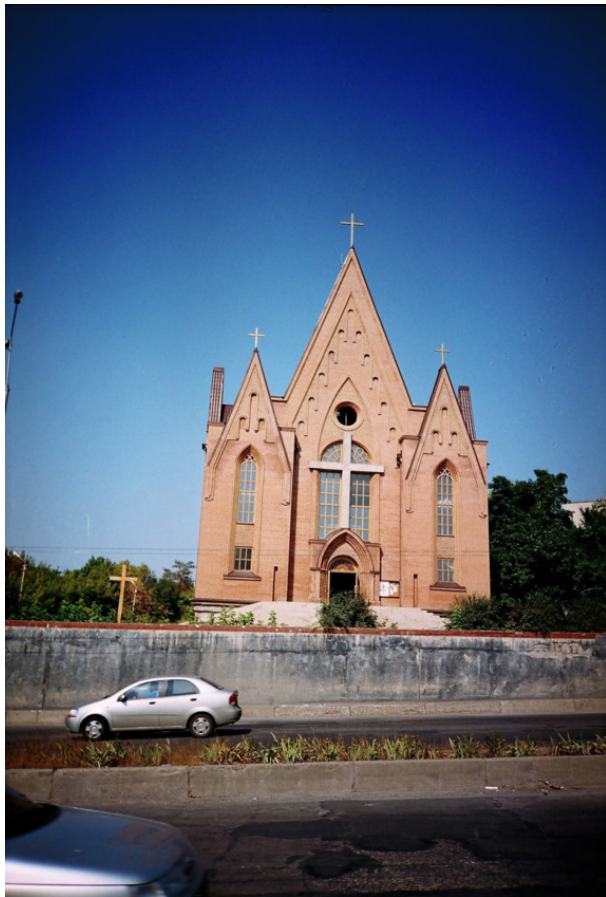
Римско – католическая церковь Святого Иосифа. XXI век.

В Волновахском районе в с. Никольском находятся муж-