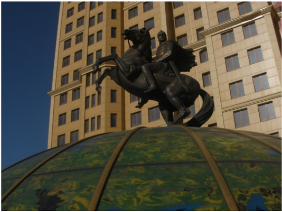
Князь Александр Невский