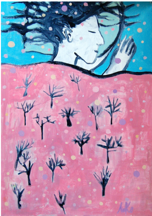
Сон декабря (2018)

Жило да было семейство бобров. Крепкая такая лесная семейка, строили плотины, делали запруды, растили боб-