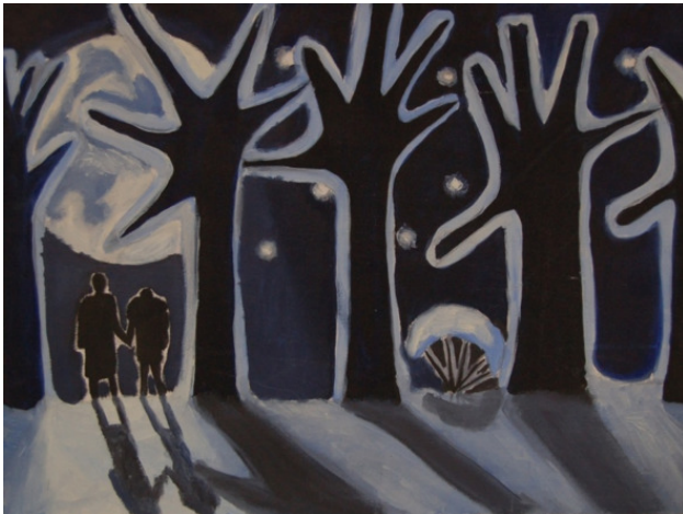
Зимняя ночь (2008)

«Вот же разиня!» – послышался окрик. «Да что с него взять, руки дырявые!» – эхом ответили... родные. Родные? Впервые в жизни троллик засомневался, что заслуживает такое отношение. Он вскочил, сжав маленькие кулачки, и закричал, что он не виноват, что тулуп очень тяжёлый, что оступился он именно поэтому! Ответом ему был смех и крики о том, что коли не нравится, так может валить куда подальше, а тулуп-то оставь, он ещё дедов! Тебе не нравится, так не таким переборчивым пригодится!