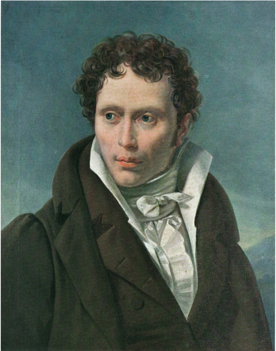
Артур Шопенгауэр (1788 – 1860)

Ницше отрекся от христианства и традиционной морали, заявил, что Бог мертв, а на место Бога он ставил воображаемого, всемогущего сверхчеловека, который в двадцатом столетии был воплощен Адольфом Гитлером, одним из почитателей его трудов.