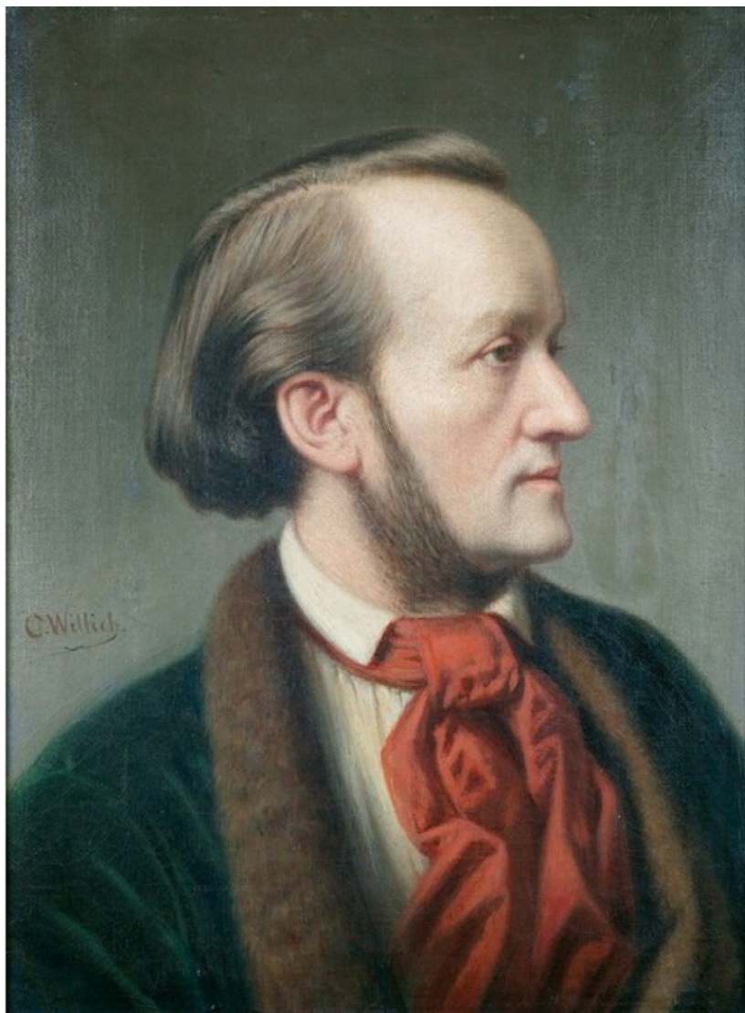
Рихард Вагнер (1813 – 1883)

Композитором Рихардом Вагнер, с которым Фридрих Ницше в те годы сдружился, поделил его увлечение Шопенгауэром. Вагнер был бывшим студентом Лейпцигского университета и гораздо старше Ницше.