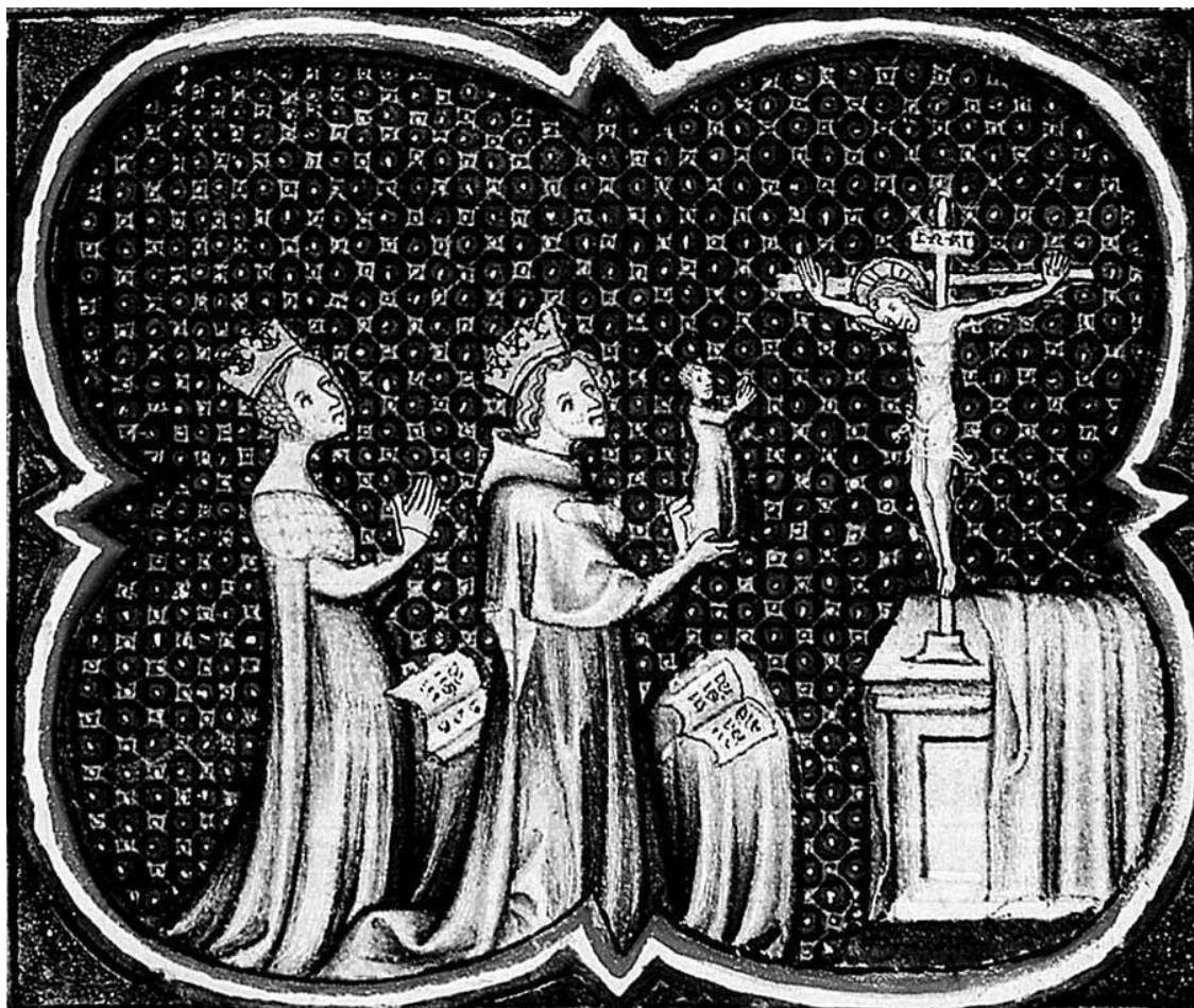
Людовик VII и Алиенора молят Господа о даровании сына. Средневековая миниатюра. Фото репродукции

такой любящий, начинает изменять Алиеноре и решает заточить надоевшую жену в отдаленном замке. Она провела в этом относительно почетном заключении целых шестнадцать лет.