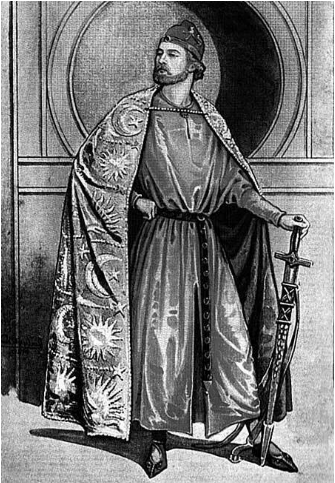
Ричард Львиное Сердце. Фото репродукции

ческую ценил крайне низко. Как это сочеталось? Вера в Бога и безрассудная смелость, при которой жизнь не стоила и копейки! Трудно сказать, трудно понять.