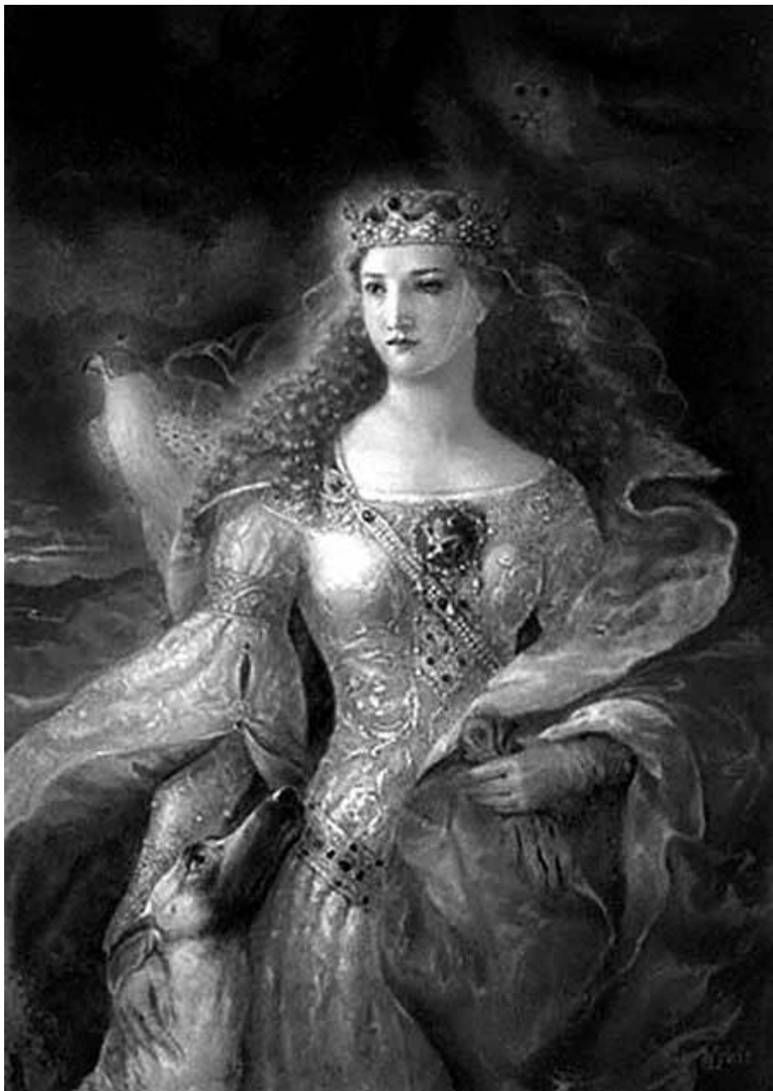
Неизвестный художник. Алиенора Аквитанская. XIX в. Фото репродукции

Постепенно ранние Капетинги шаг за шагом наращивали свое влияние. Особенно заметно это стало при Людовике VI, прозванном Толстым. Его умный и образованный советник аббат Сугерий сумел всеми доступными ему средствами добиться брака сына короля, тоже Людовика, и блестящей «аквитанской невесты». Прямо во время свадебного пира, который проходил в Бордо, пришло известие о смерти Людовика VI. Получилось, что Алиенора вышла