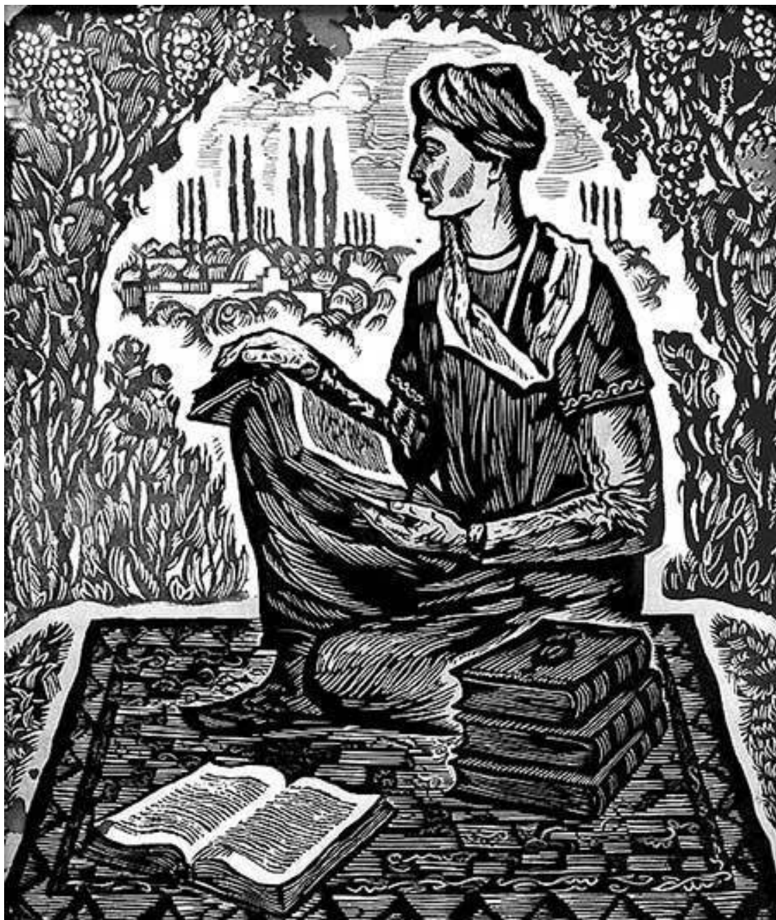
Авиценна. Экспонат музея Авиценны в Бухаре. Фото репродукции

В доме его отца собирались ученые люди, исмаилиты – представители одного из течений в исламе. Их рассуждения были очень похожи на ересь, со временем их и признали еретиками. Они хотели очистить Коран от невежественных наслоений, призвав на помощь философию. Опасное занятие. Маленький Авиценна присутствовал при этих беседах, но повзрослев, не принял исмаилитский образ мышления. А вот его брат увлекся этими взглядами. Авиценна же официально остался в рамках ортодоксального ислама, хотя ортодоксом никогда не был.