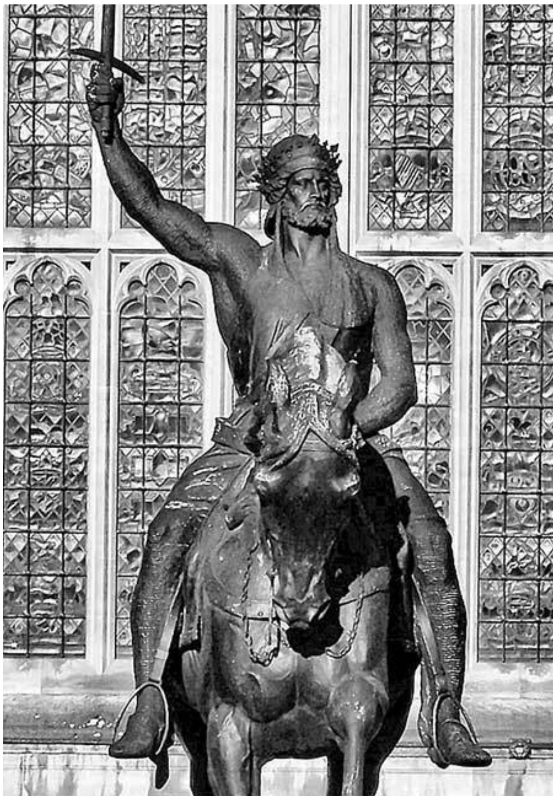
Памятник Ричарду Львиное Сердце у здания парламента в Лондоне. Установлен в 1860 г. Современный вид

Нужно сказать, что в жизни Ричарда был свой Улисс – Филипп II Август, французский король, хитрости которого хватило бы не на одну сотню правителей. Он не бился в открытых боях, но неизменно выигрывал в политических интригах. Филипп бросил Ричарда в Крестовом