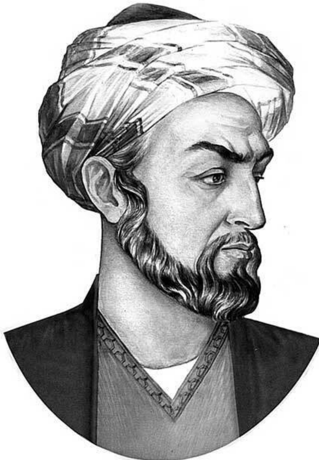
Авиценна. Фото репродукции

Микеланджело считал, что «лучше ошибиться, поддерживая Галена и Авиценну, чем быть правым, поддерживая других». Такая оценка, скорее морального свойства, из уст великого гуманиста многого стоит. Специалисты спорят о количестве трудов Авиценны, причем называются цифры и 90, и 456. Очевидно, ему приписываются подделки, подражания – талантам всегда подражают. Самая гениальная его книга – «Канон врачебной науки». Но и другие труды вошли в историю, стали классическими – «Книга спасения», «Книга знания», «Книга