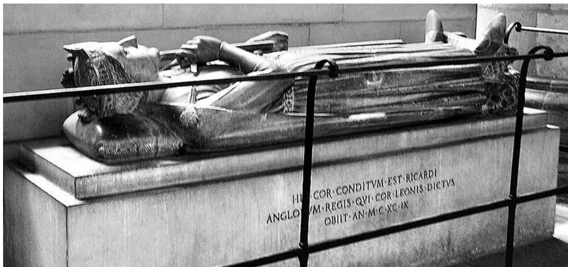
Саркофаг Ричарда Львиное Сердце. Фото репродукции