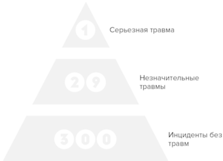
РИС. 1.1. Пирамида травматизма (закон Хейнриха)